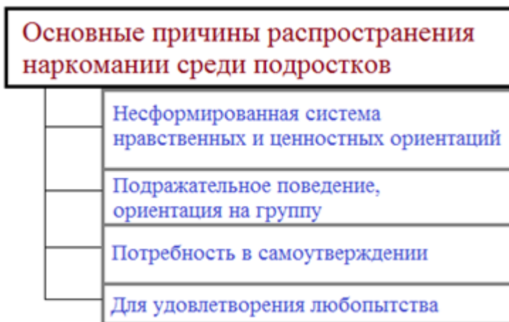
Рисунок 3. Основные причины распространения наркомании среди подростков

Среди причин распространения наркомании в подростковой среде выделяют следующие: