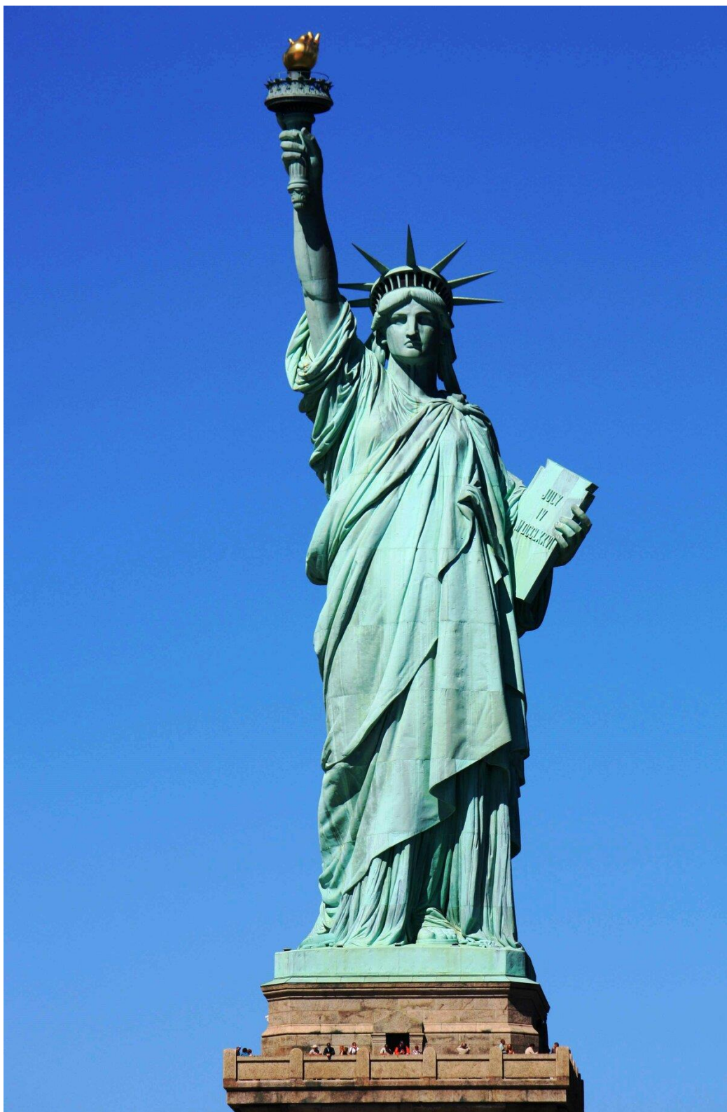
Фотография 1. Статуя Свободы в США 141 .