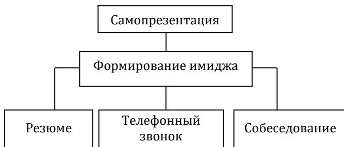
Рис. 2. Практические навыки самомаркетинга и самопрезентации

Для решения поставленных задач необходимо комплексное сочетание принципов, форм и методов преподава-