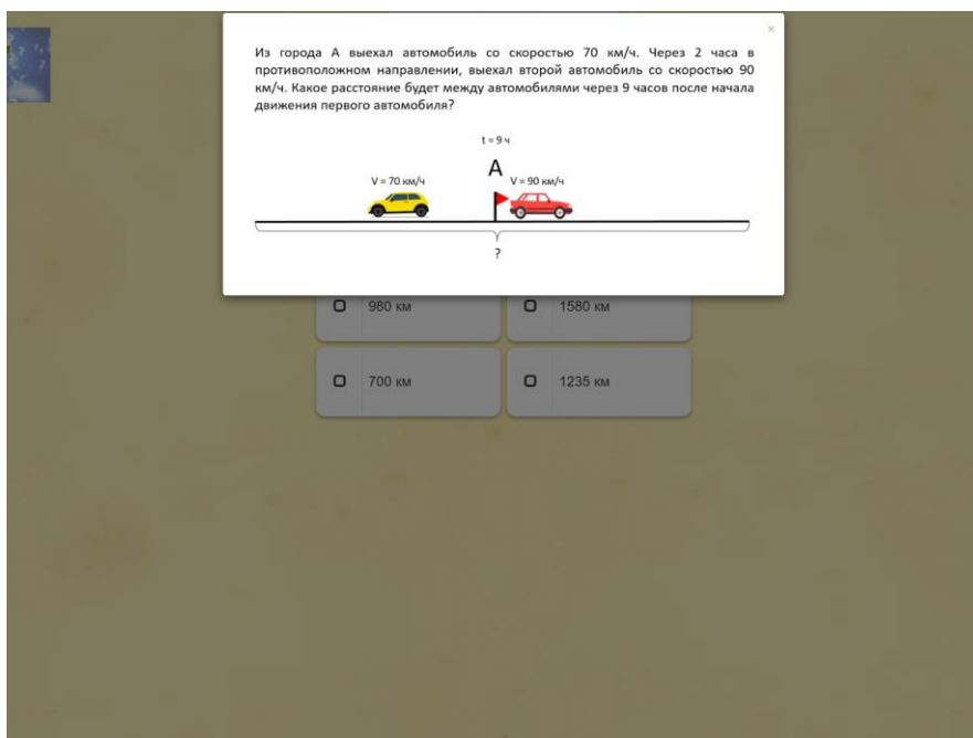
Рисунок 4 – Решение задач на движение повышенной сложности на платформе «LearningApps»

строить план для решения определенной задачи. На данном этапе младшие школьники сталкиваются с задачами, имеющими дополнительные данные. Это создает усложнение. Один из объектов задачи начинает движение раньше, добавляются остановки на пути и т.д. Они решают задачи, учитывая все эти сложности. Фрагмент выполнения одного из упражнений представлен на рисунке 4.