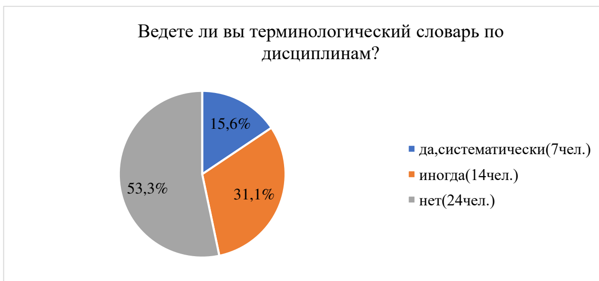
Рисунок 4 – Результат ответа на вопрос «Ведёте ли Вы терминологический словарь?»

Это свидетельствует о необходимости активизации самостоятельной работы студентов с терминологией, включения в систему учебных заданий составления и ведения терминологических глоссариев, разработки методических рекомендаций по организации такой работы.