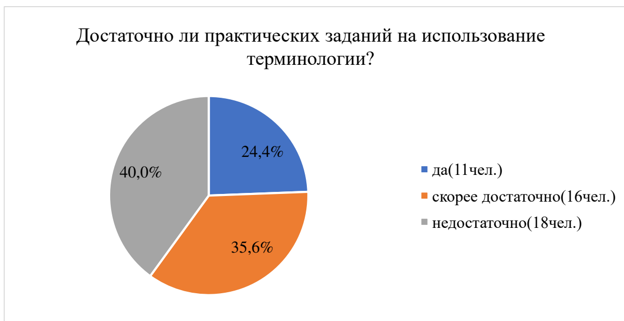
Рисунок 5 – «Достаточно ли практических заданий на использование терминологии?»

Это свидетельствует о необходимости активизации самостоятельной работы студентов с терминологией, включения в систему учебных заданий составления и ведения терминологических глоссариев, разработки методических рекомендаций по организации такой работы.