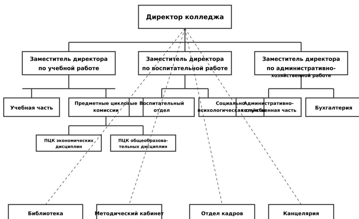
Рисунок 1 – Организационная структура ГБПОУ «МКБТ»

Структура управления колледжем представлена на рисунке 1.