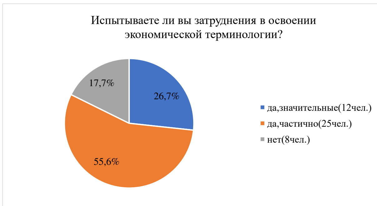
Рисунок 2 – Результат ответа на вопрос «Испытываете ли Вы затруднения в освоении экономической терминологии»

На основе данных из таблицы составлены диаграммы (рис.2-5)