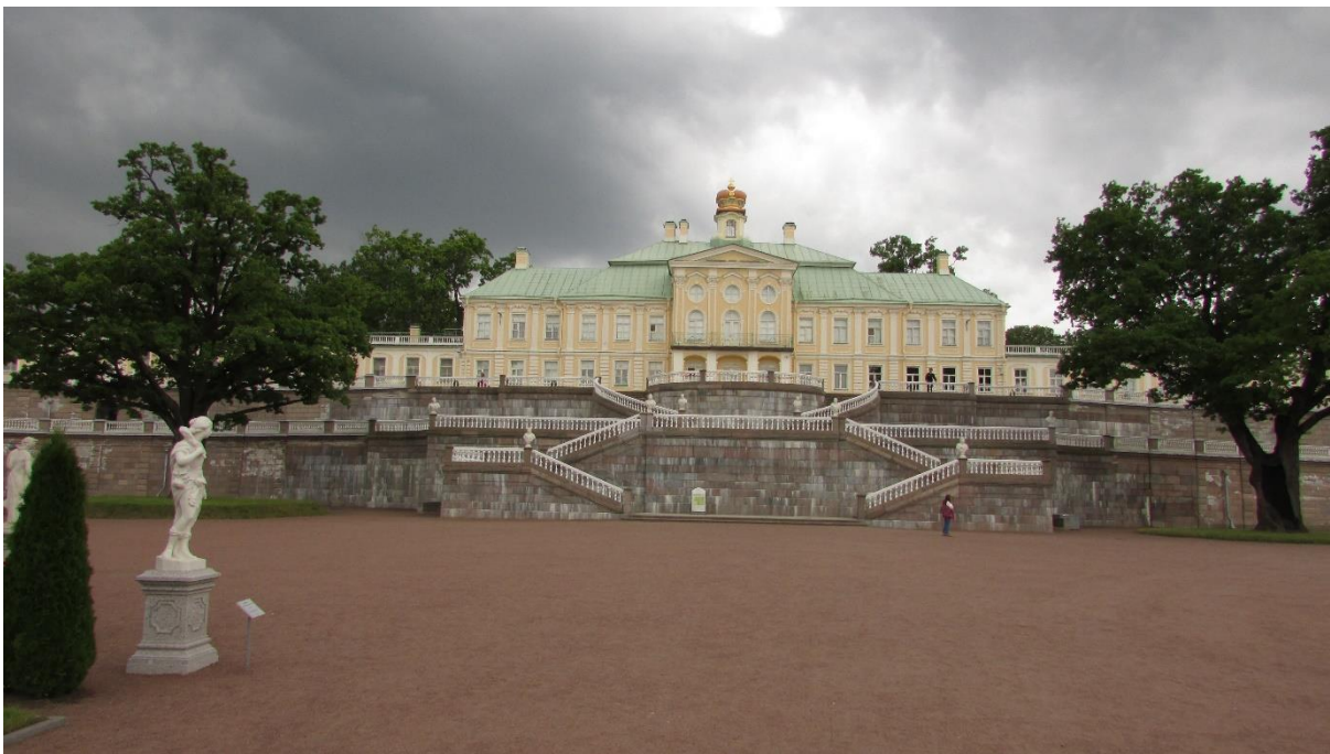
Рисунок 14 – Северный фасад Большого Меншиковского дворца

Старейшим сооружением дворцово-паркового ансамбля является Большой (Меншиковский) дворец (рисунок 14), возведённый по проекту архитекторов Ф. Фонтана и И. Г. Шеделя в 1710–1727 гг. Дворец расположен на краю естественной возвышенности и делит парк Ораниенбаума на две неравные части – Нижний сад, имеющий регулярную планировку, и пейзажный Верхний парк.