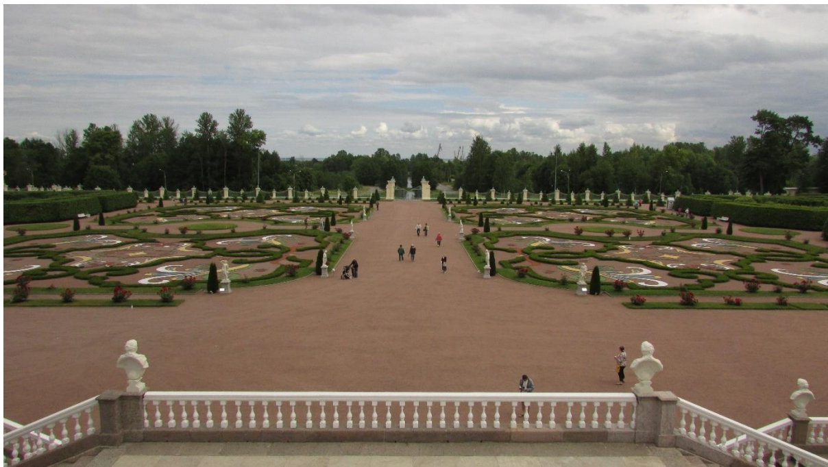
Рисунок 15 – Нижний сад Ораниенбаума

в саду сохраняется только центральная аллея и появляются газоны с клумбами.