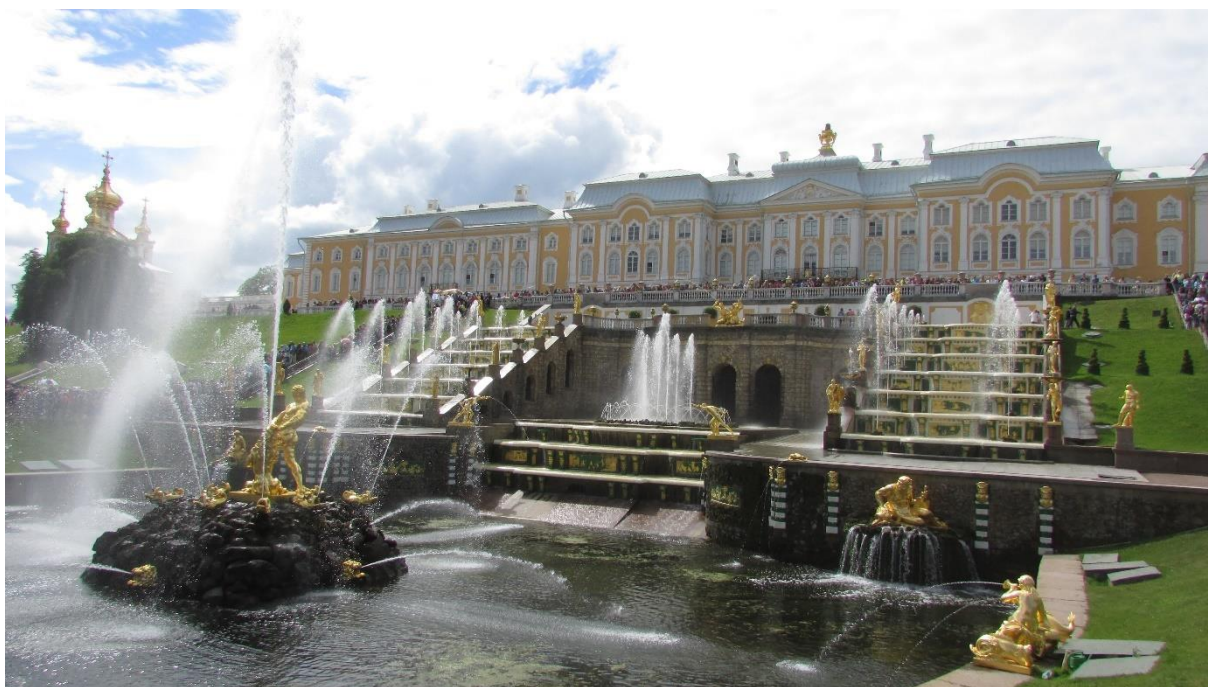
Рисунок 1 – Вид на Большой Петергофский дворец и Большой каскад в сезон фонтанов

Петергоф – это исторический дворцово-парковый ансамбль, находящийся на южном берегу Финского залива, расположен на территории муниципального образования город Петергоф (с 1944 по 1997 гг. – Петродворец) в Петродворцовом районе Санкт-Петербурга. Находится под управлением Государственного музея-заповедника «Петергоф».