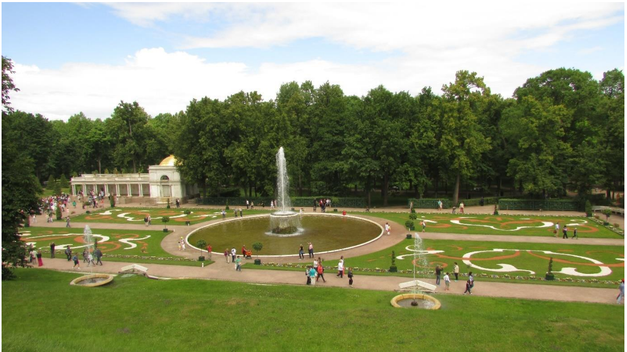
Рисунок 2 – Фрагмент центрального ансамбля Нижнего парка в Петергофе

Состоит из трех ансамблей, связанных между собой – центрального (рисунок 2), западного и восточного, каждый, в свою очередь, состоит из малых ансамблей. Основой планировки парка являются две системы лучевых аллей (с север на юг и с востока на запад), которые пересекаются друг с другом. Все основные аллеи парка заканчиваются «водным» объектом – либо выходят к заливу, либо заканчиваются фонтаном.