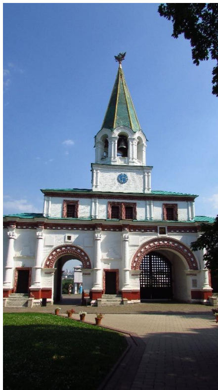
Рисунок 21 – Передние ворота в Коломенском

Водовзводная башня – памятник архитектуры, свидетель многих исторических событий.