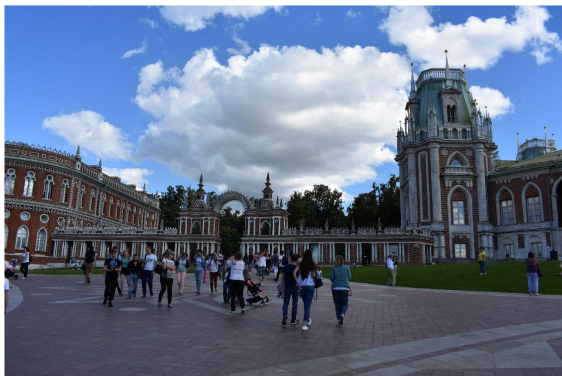
Рисунок 18 – Большой Царицынский дворец