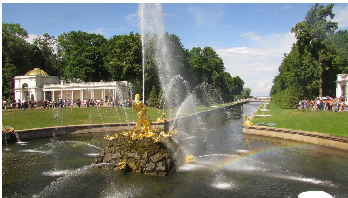
Рисунок 4 – Фонтан «Самсон, раздирающий пасть льва»

Всего в Петергофском дворцово-парковом ансамбле насчитывается 189 фонтанов и три каскада. Основу петергофских фонтанов и каскадов составляет водовод, который является памятником русской гидротехники XVIII в. – первой половины XIX в. Пруды и каналы водовода вписаны в композицию Верхних Лугового, Колонистского и Английского парков. Из фонтанного водовода наполняются водоёмы соседнего Александрийского парка, который также является центром притяжения туристов и управляется ГМЗ «Петергоф». Петергоф также известен своими ежегодными праздниками, такими как «Фонтанный день» и «Фонтанный фестиваль», когда все фонтаны в парке включаются и создают удивительные водные шоу [6].