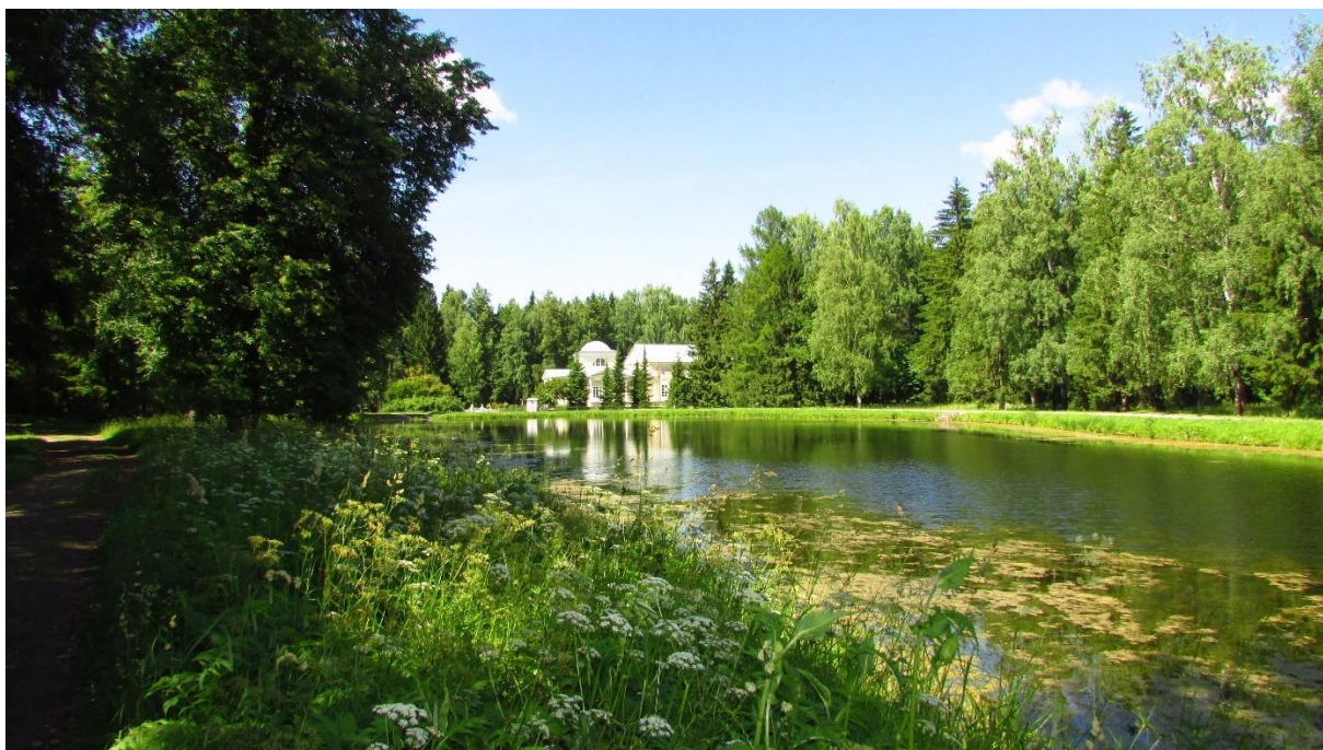
Рисунок 13 – Вид на Розовый павильон

Парадное поле создано по проекту В. Бренна в конце Тройной липовой аллеи и предназначалось для военных манёвров. После смерти Павла в 1803-1813 гг. декоратор П. Гонзаго превратил этот район в живописный парк, где лужайки и рощицы сочетаются с деревьями и кустарниками, преимущественно северной и средней полосы России, строго подобранными с учётом их цветовой гаммы в разное время года. На Парадном поле расположены объекты культурного наследия: Розовопавильонные пруды, Олений мост и другие.