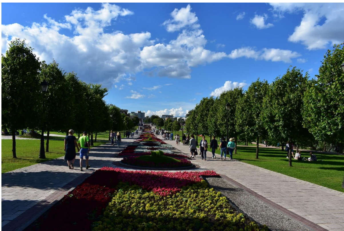
Рисунок 19 – Царицынский пейзажный парк

Царицыно известно своими живописными пейзажами и архитектурным стилем. Дворец, выполненный в готическом стиле, с высокими башнями и разнообразными декоративными элементами, создает атмосферу сказочности. Парк, окружающий комплекс, привлекает внимание своими ухоженными дорожками, множеством прудов и мостиков, а также редкими растениями.