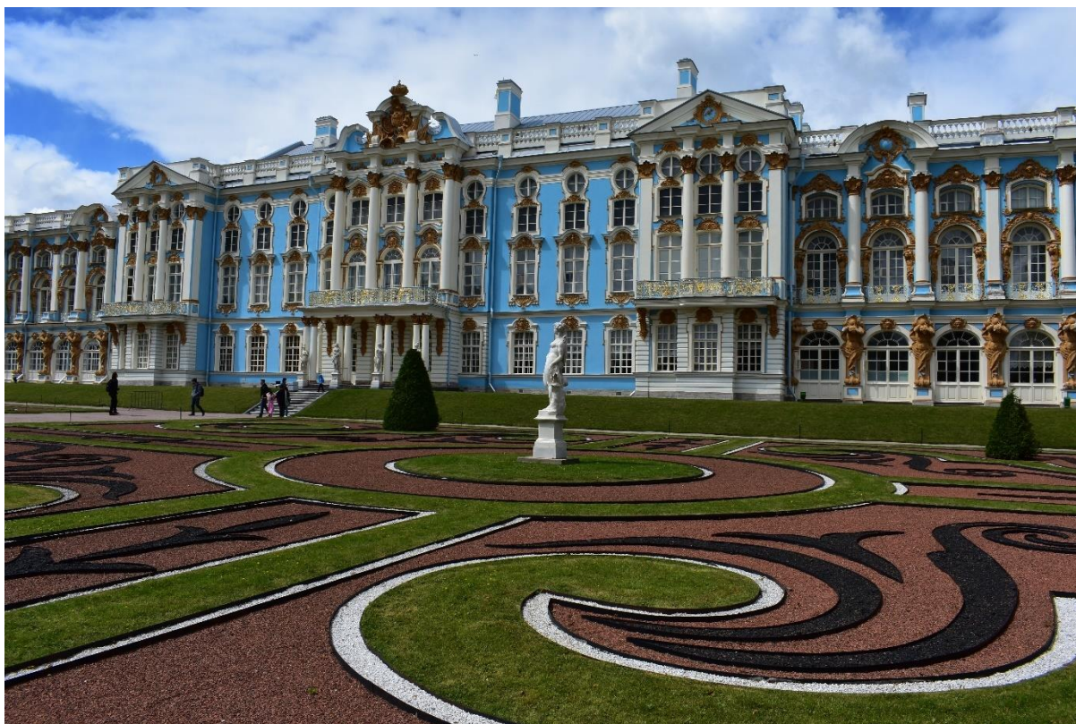
Рисунок 5 – Фрагмент фасада Большого Екатерининского дворца

Одно из самых известных помещений дворца – Янтарная комната. Основное убранство комнаты изготовлено в начале XVIII века в Пруссии, в 1716 г. подарено королём Фридрихом Вильгельмом I Петру I, в 1746 смонтировано в Зимнем дворце Санкт-Петербурга, в 1755 г. перенесено в Царское Село. В годы ВОВ убранство Янтарной комнаты вывезено немцами, предположительно, в Кенигсберг и дальнейшая судьба оригинальной комнаты неизвестна. С 1979 г. в Санкт-Петербурге велась работа по воссозданию Янтарной комнаты, к 2003 г. она была воссоздана в полном объёме, в том числе на средства немецких фирм.