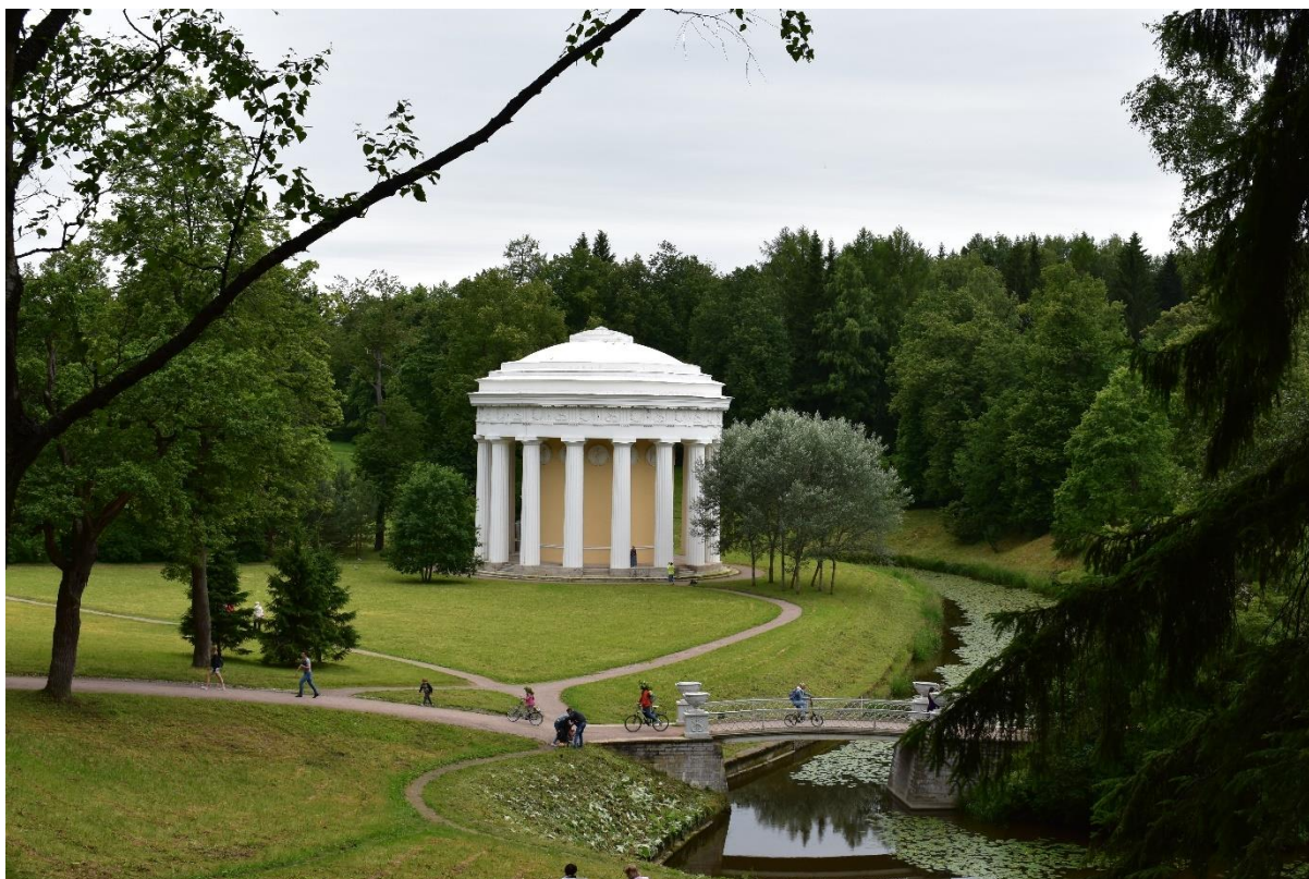
Рисунок 11 – Храм Дружбы в Павловском парке

благодетелю), а также мосты над Славянкой, мраморная и бронзовая скульптура.