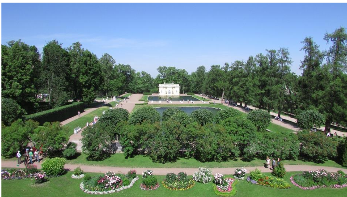
Рисунок 7 – Регулярный парк в Екатерининском саду

Регулярный парк (рисунок 7) был распланирован в 1720-х гг голландцами Я. Роозеном и И. Фохтом на трёх уступах перед императорским дворцом. В это же время на третьем уступе были устроены Зеркальные пруды, а на речке Вангазе, стекавшей с холма, ещё два пруда: Верхний (Большой) и Мельничный (позже вошедший в систему Каскадных, или Нижних прудов).