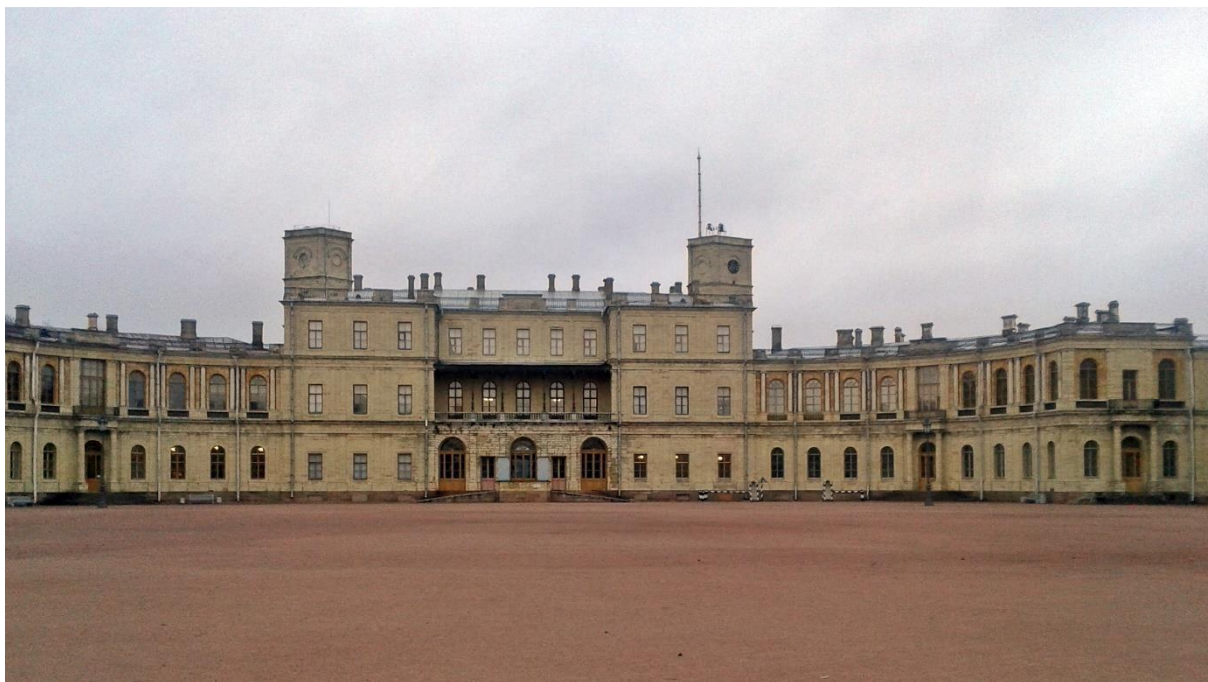
Рисунок 16 – Южный фасад Большого Гатчинского дворца и плац перед ним

Две пятигранные башни — часовая и сигнальная.