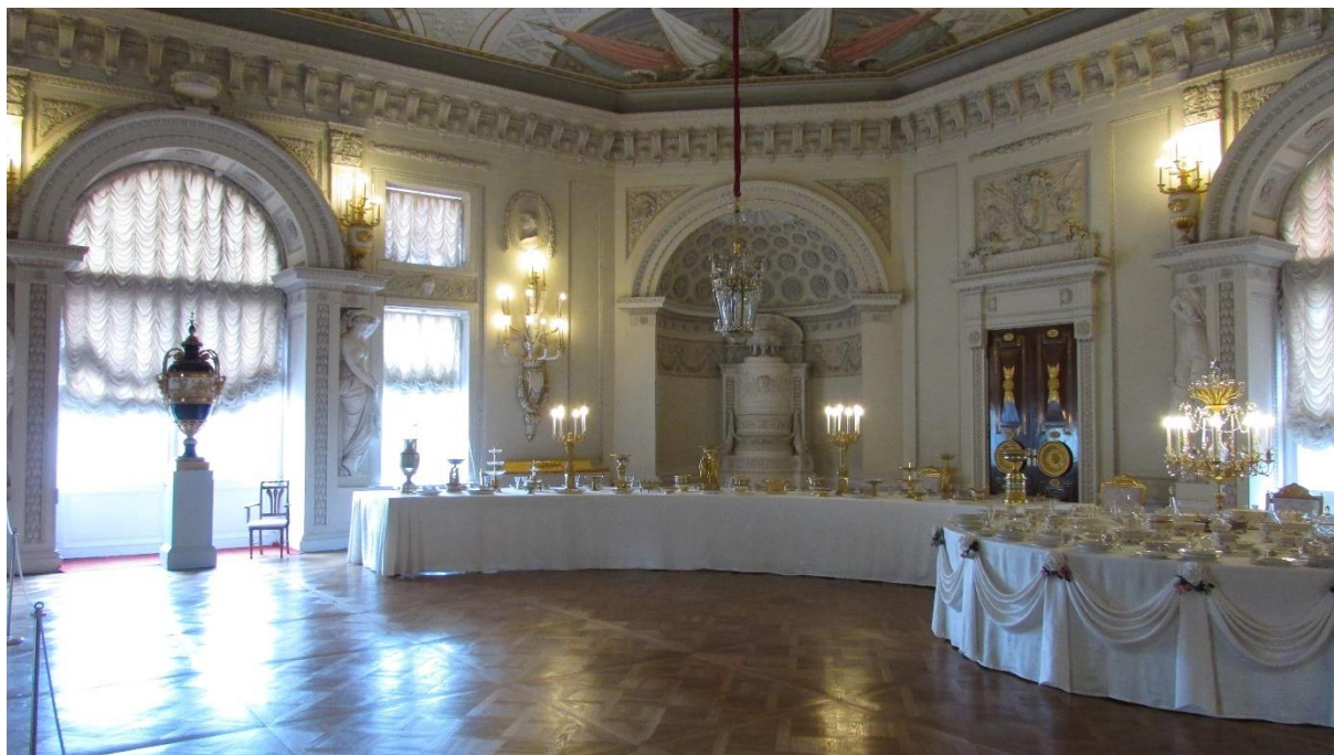
Рисунок 10 – Столовая в Павловском дворце

Парадный (Верхний) вестибюль и Парадная лестница, библиотека, картинная галерея, столовая (рисунок 10), будуары, спальни, кабинеты, проходные комнаты и т. д.