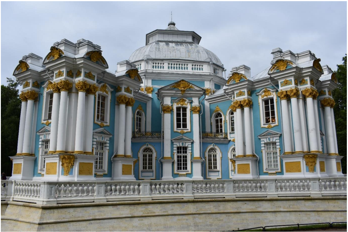
Рисунок 8 – Павильон Эрмитаж на территории регулярного парка

В соответствии с новыми веяниями моды в русском садово-парковом искусстве, во второй половине XVIII в. парк расширили, и к юго-западу от старого сада, вокруг Большого пруда, возник новый район, решённый в пейзажном стиле. Извилистые дорожки, живописно расположенные группы деревьев, многочисленные беседки, павильоны, мостики, разбросанные совершенно случайно создают контраст с организованностью регулярной части [6].