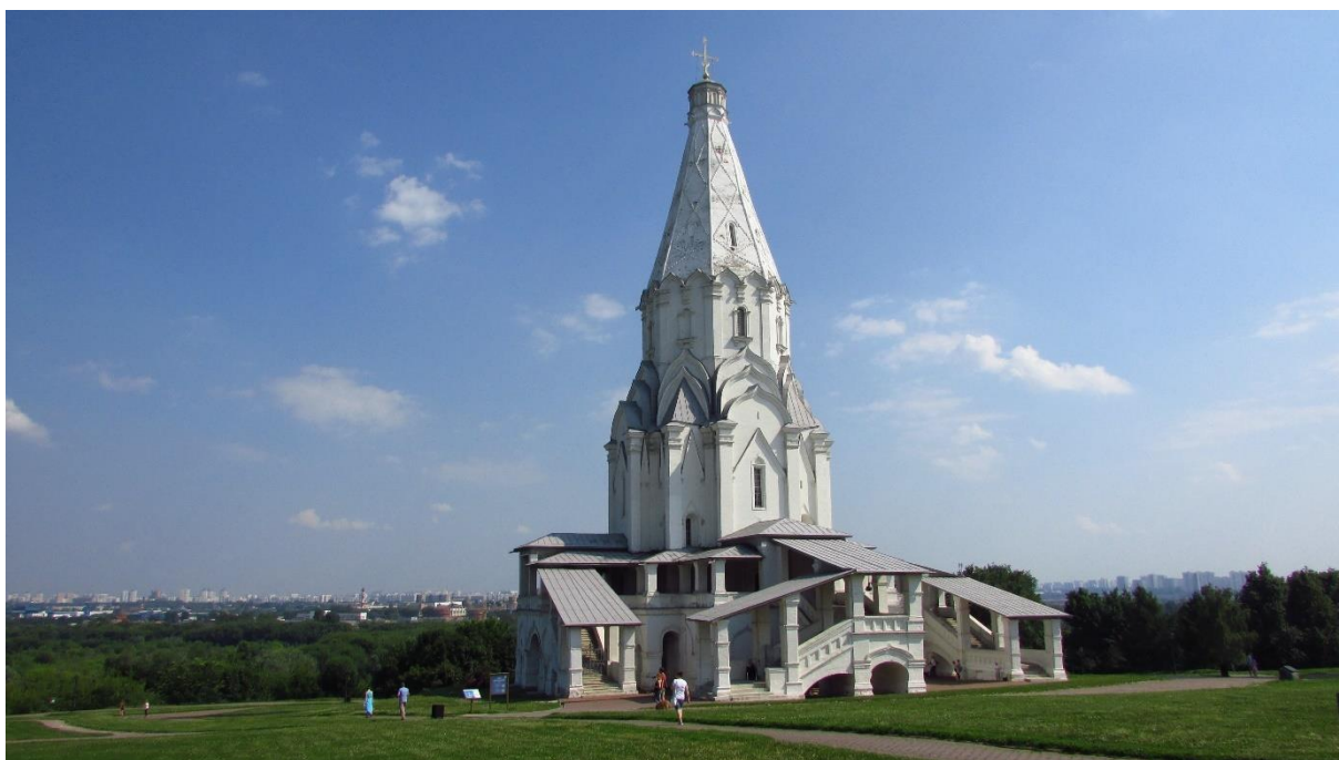
Рисунок 20 – Церковь Вознесения Господня в Коломенском

Музей-заповедник «Коломенское» – культурно-исторический объект, расположенный вдоль Москвы-реки, который не только окружен парками, но и является площадкой, где история и природа переплетаются в единое целое.