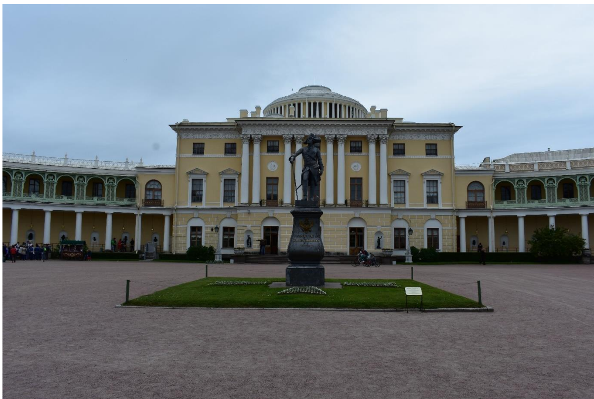
Рисунок 9 – Парадная часть Павловского дворца

Период первого строительства дворца начался в 1782 г. Над созданием дворца в стиле классицизм работали выдающиеся архитекторы: Ч. Камерон, В. Бренна, Д. Кваренги, А. Н. Воронихин, К. И. Росси. 12 декабря 1777 г. по случаю рождения первого внука, будущего императора Александра I, императрица подарила эти земли (ранее выкупленные в казну) сыну, великому князю Павлу Петровичу.