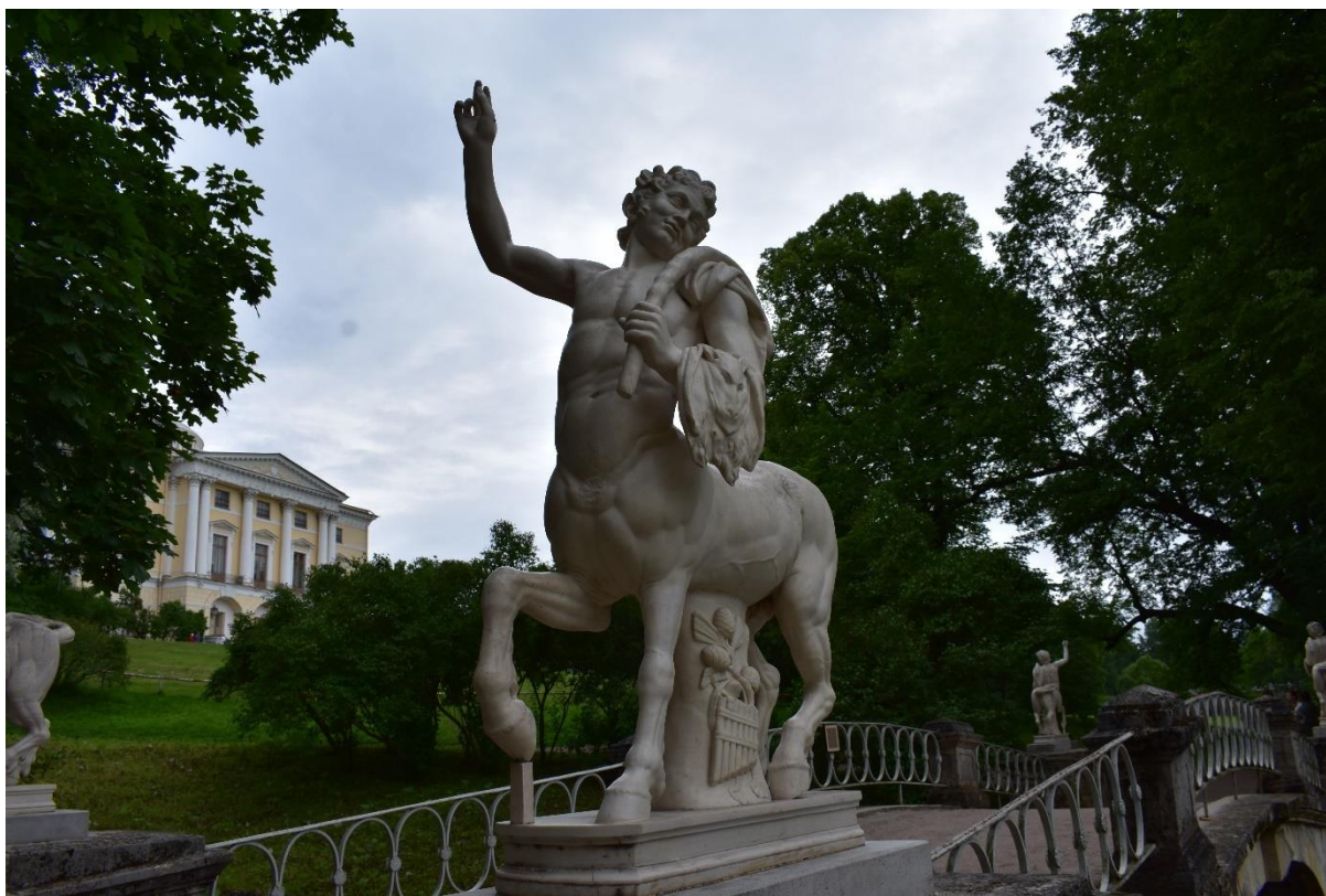
Рисунок 12 – Мост Кентавров в Павловском парке

Прилегающие ко дворцу территории выполнены по планам Ч. Камерона в регулярном стиле. Здесь расположены охраняемые государством объекты культурного наследия: Собственный садик с павильоном Трёх граций, павильон Вольтер, павильон Росси, Большие круги, Большая каменная лестница, Воздушный театр, Молочный домик и другие.