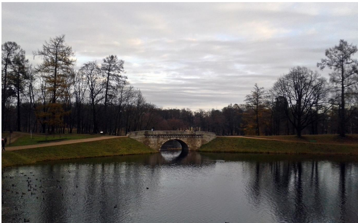
Рисунок 17 – Гатчинский парк

детали были закрыты временными щитами. В 1948 г. были восстановлены межэтажные перекрытия, кровля, оконные и дверные проёмы. Однако, полноценные реставрационные работы проводятся только с 1980-х гг. и по сей день.