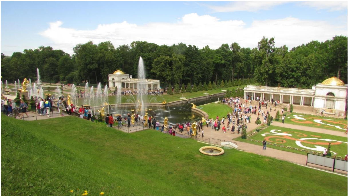
Рисунок 3 – Большой каскад и Нижний парк в разгар турсезона

Символом всего ансамбля является фонтан «Самсон, раздирающий пасть льва» (рисунок 4), установленный в 1735 г., частично утраченный (статуя Самсона) в ВОВ и восстановленный в 1947 г. Считают, что фигура Самсона появилась в связи с Полтавской победой над шведами (символом которых является лев), одержанной в день Сампсона Странноприимца. От «Самсона» до залива проходит Морской канал и аллея фонтанов. К двум важным элементам центральной части относятся Мраморные Воронихинские колоннады и Фонтаны «Адам» и «Ева» – единственные в Петергофе, сохранившие своё изначальное скульптурное убранство и не менявшиеся на протяжении трех веков.