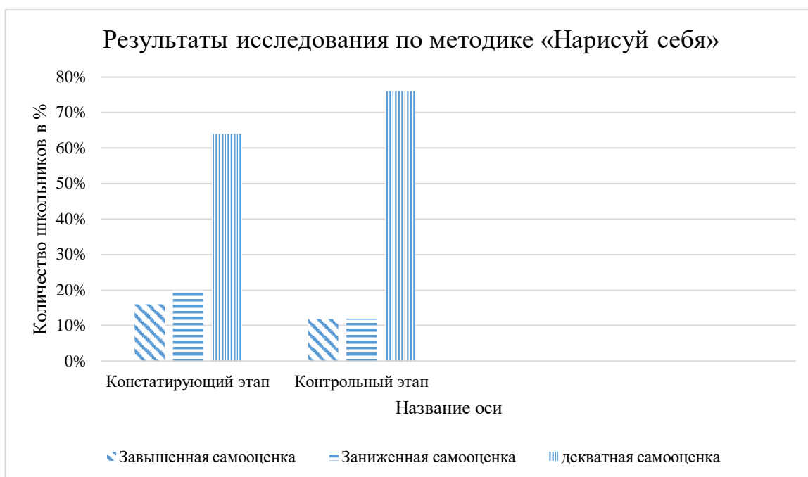
Рисунок 3 – Результаты исследования по методике «Нарисуй себя»

На констатирующем этапе классный руководитель оценил испытуемых следующим образом: адекватной самооценкой обладают 16 чел. (что составило 64% от общего числа испытуемых); у 4 человек (16%) была отмечена самооценка как неадекватно-заниженная и у 5 человек (20%) самооценка была определена как неадекватно-завышенная. На контрольном этапе классный руководитель оценил испытуемых следующим образом: адекватной самооценкой обладают 20 человек (что составило 80% от общего числа испытуемых); у 2 человек (8%) была отмечена самооценка как неадекватно-заниженная и у 3 человек (12%) самооценка была определена как неадекватно-завышенная (Рис.4).