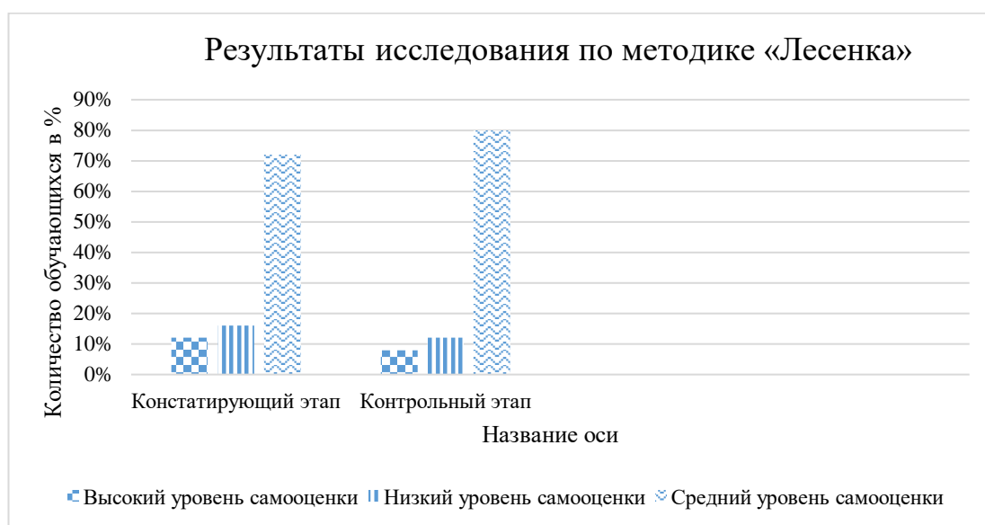
Рисунок 2 – Результаты исследования по методике «Лесенка»

Исходя из полученных результатов исследования по методике «Лесенка», мы определили, что у 3 человек (что составило 12% от общего числа испытуемых) выявился высокий уровень самооценки, у 18 школьников (что составило 72% от общего числа испытуемых) - средний уровень, а у 4 обучающихся (что составило 16% от общего числа испытуемых) – низкий уровень самооценки. После применения методик можно заметить, что результат значительно изменился (Рис.2).