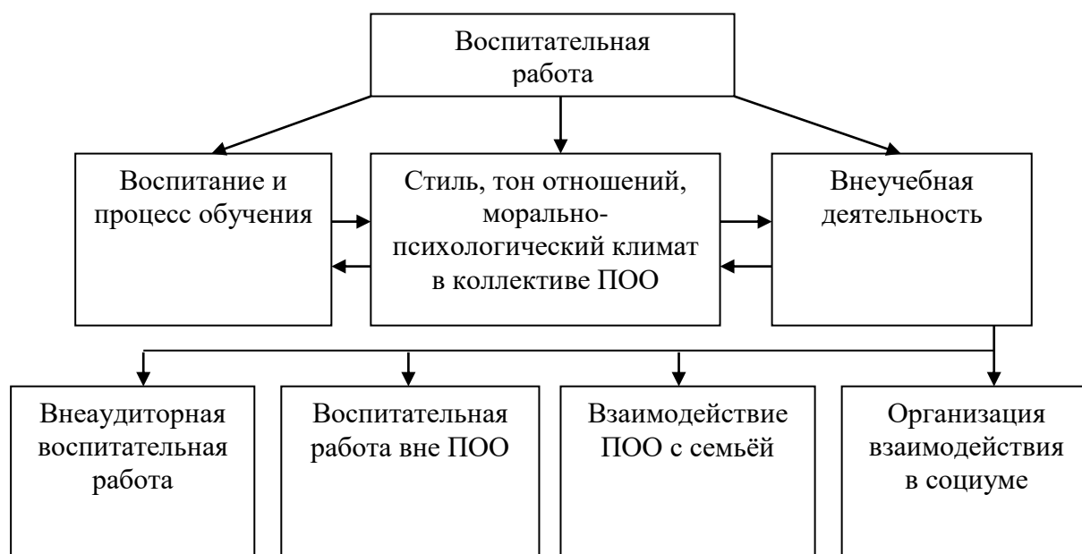
Рисунок 2 – Система воспитательной работы ПОО

Воспитательная работа в ПОО – многогранный и сложный процесс воздействия на личность, на его мастерство и интересы, осуществляемый как на занятиях, так и во вне урочное время. Комплексная система воспитательной работы (рисунок 2) обеспечивает формирование у обучающихся мировоззрения, активной жизненной позиции, навыков общественного поведения и основ нравственности.