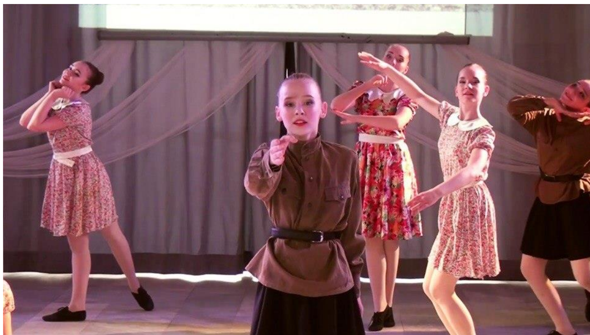
Рисунок 4 – Военно-патриотический танец «Попурри на военные песни»