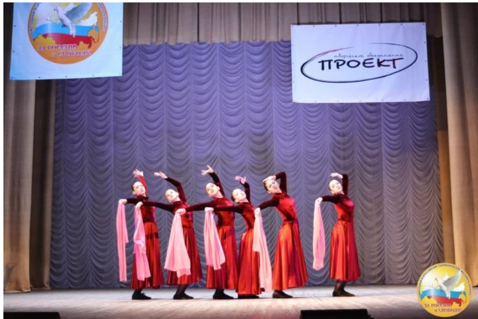
Рисунок 3 – военно-патриотический танец «Молитва»