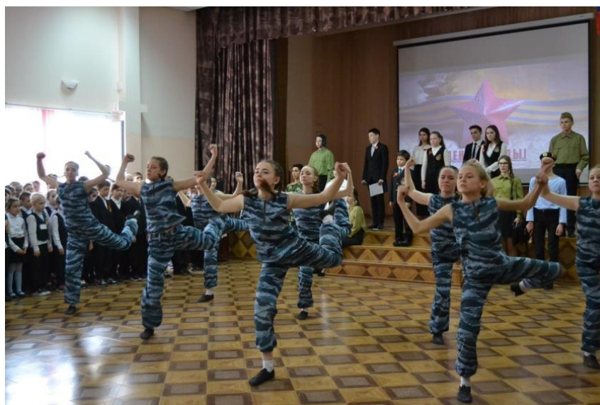
Рисунок 1 – Военно-патриотический танец «Комбат»