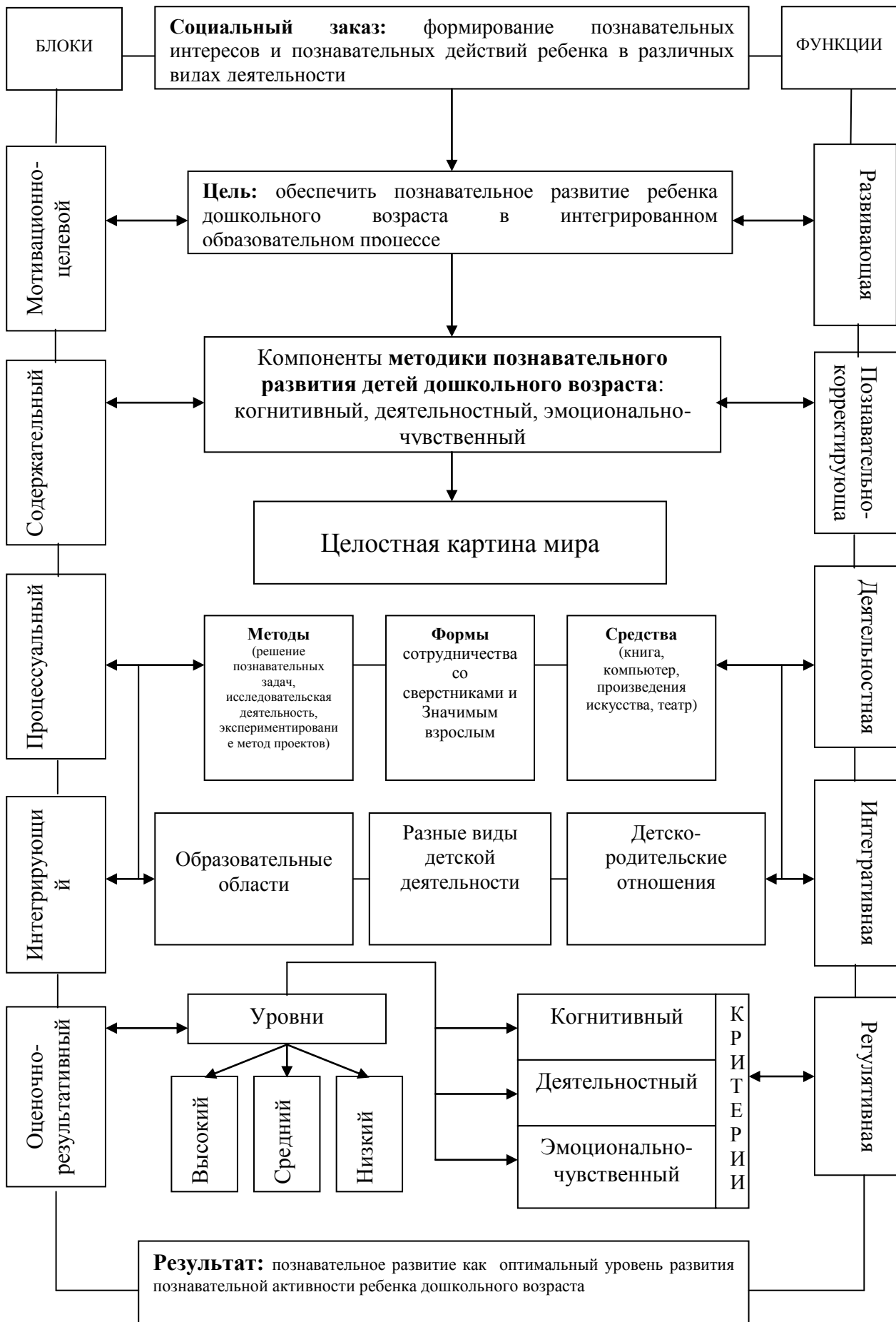
Рисунок 2 – Структурно-функциональная модель методики познавательного развития детей дошкольного возраста