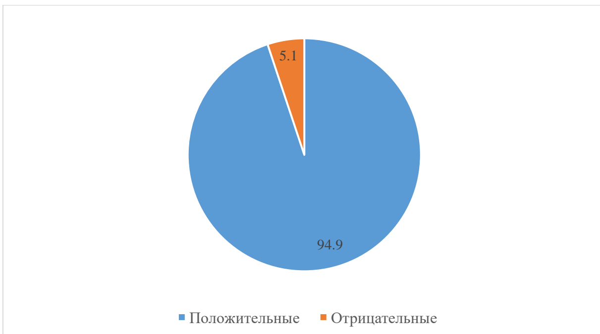
Рисунок 2 – Степень удовлетворенности взаимодействием семьи и школы

Третье направление исследования: определение стиля воспитания в семье. Дополнительная информация позволит понять, как взаимосвязан стиль воспитания в семье со степенью удовлетворенности родителей взаимодействием с семьей. Для выявления стиля воспитания в семьях использовалась методика «Стратегии семейного воспитания» (С. С. Степанова в модификации И. И. Махониной). Родителям были даны 10 вопросов с высказываниями, задача родителей – выбрать наиболее предпочтительный.