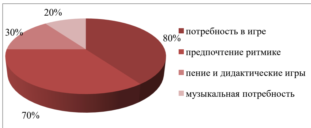
Рисунок 2 - Уровень педагогической компетентности в вопросах интеграции и современных методик

Для большей наглядности данные представлены на рисунке 2.