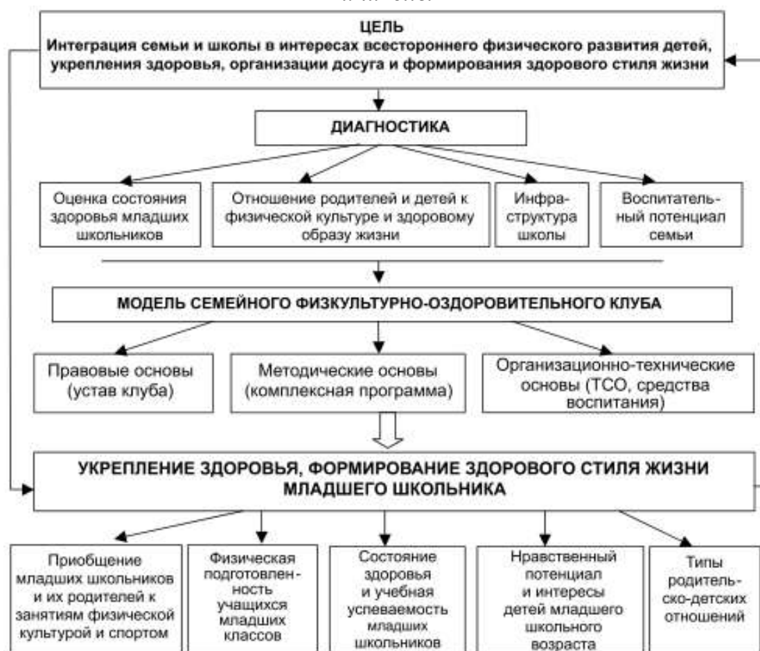
Схема инновационной педагогической технологии взаимодействия семьи и школы