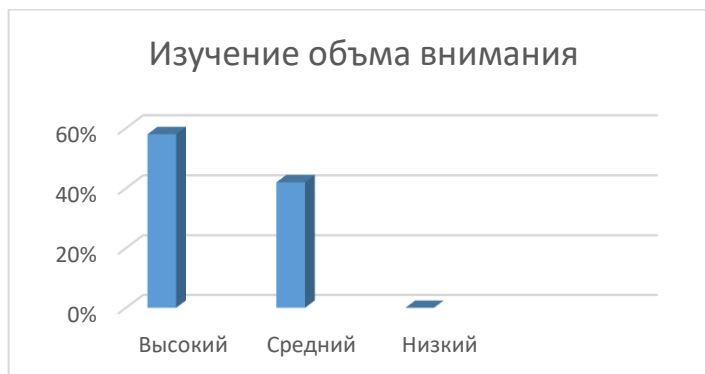
Рисунок 6. Результаты повторной диагностики на определение уровня развития объема внимания.

Результаты повторного исследования развития внимания у детей старшего дошкольного возраста с задержкой психического развития на рисунке 6.