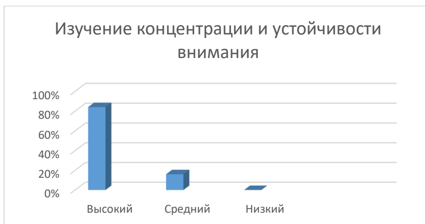
Рисунок 5. Результаты повторной диагностики на определение уровня развития концентрации и устойчивости внимания.

Результаты повторного исследования развития внимания у детей старшего дошкольного возраста с задержкой психического развития на рисунке 5.