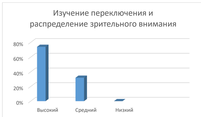
Рисунок 4. Результаты повторной диагностики на определение уровня развития переключения и распределение зрительного внимания

Результаты повторного исследования развития внимания у детей старшего дошкольного возраста с задержкой психического развития на рисунке 4.