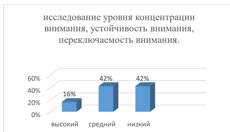
Рисунок 2. Распределение результатов диагностики развития устойчивости и концентрации внимания по методике «Корректирующая проба» на констатирующем этапе эксперимента

Результаты исследования развитие внимания у детей старшего дошкольного возраста с задержкой психического развития на рисунке 2 (см. приложение 1)