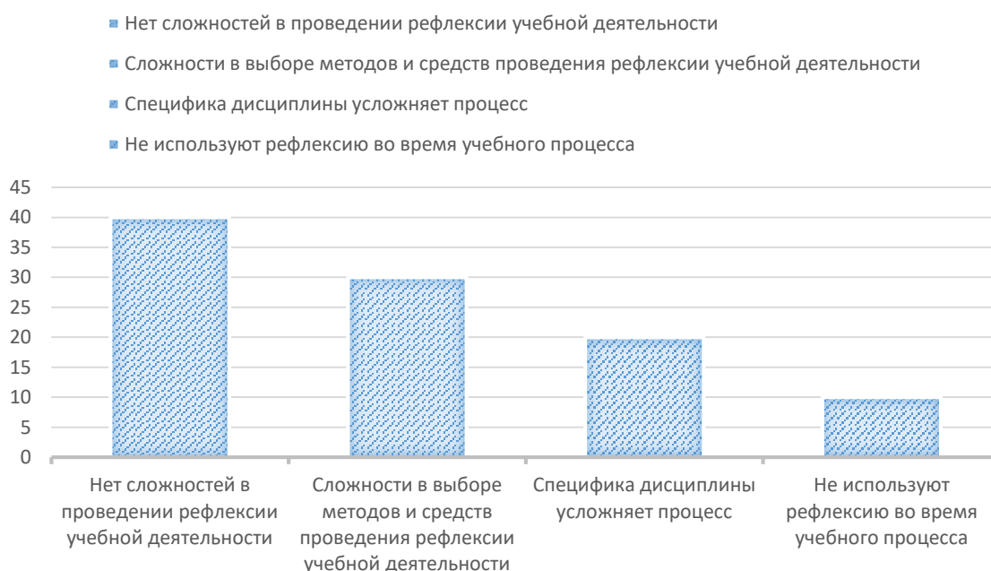
Рисунок 1 - Проведение рефлексии у преподавателей

В анкете были представлены вопросы, которые позволили узнать, какие затруднения испытывают педагоги при проведении рефлексии учебной деятельности у студентов. Всего было опрошено 10 преподавателей (Рисунок 1).