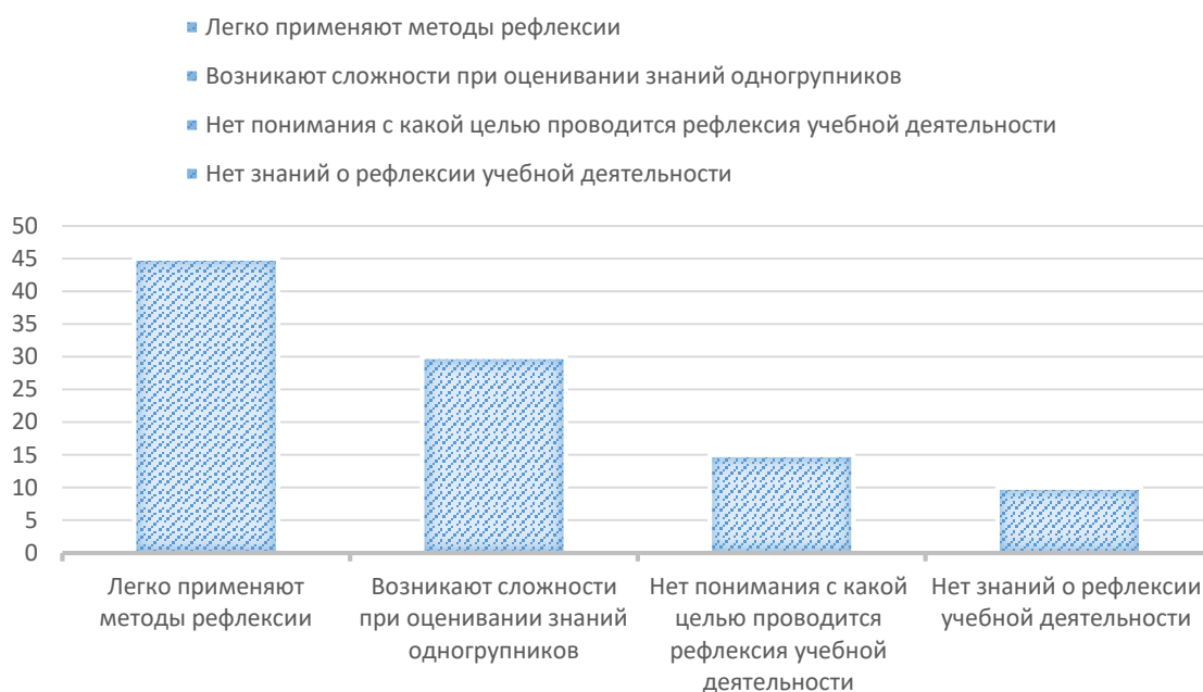
Рисунок 2 – Рефлексивные умения у студентов

Всего было опрошено 20 студентов (Рисунок 2).