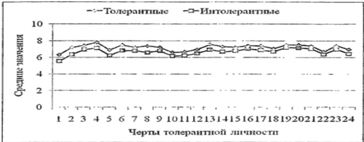
Рис. 3. Среднестатистическое значение черт толерантной личности в группах толерантных и интолерантных студентов, полученное на основе экспертных оценок одноклассников

Примечание: 1 - «альтруизм», 2 — «готовность выслушать и понять другого», 3 — «готовность отстоять свои убеждения», 4 - «доброжелательность», 5 - «доверие в отношениях», 6 - «независимость в суждениях и поступках», 7 - «любопытность», 8 - «отзывчивость и готовность помочь», 9 - «самообладание и сдержанность», 10 — «склонность не осуждать другого», 11 — «несходимость», 12 — «умение рефлексировать», 13 — «умение саморазвиваться», 14 — «умение сопереживать», 15 — «умение прощать», 16 - «способность уважать иные вкусы и обычаи», 17 — «стремление к взаимопониманию», 18 — «терпимость к недостаткам других», 19 — «уважение прав другого человека», 20 — «уважительное отношение к другому мнению», 21 — «умение владеть собой», 22 — «уступчивость», 23 - «чувство юмора», 24 - «чуткость».