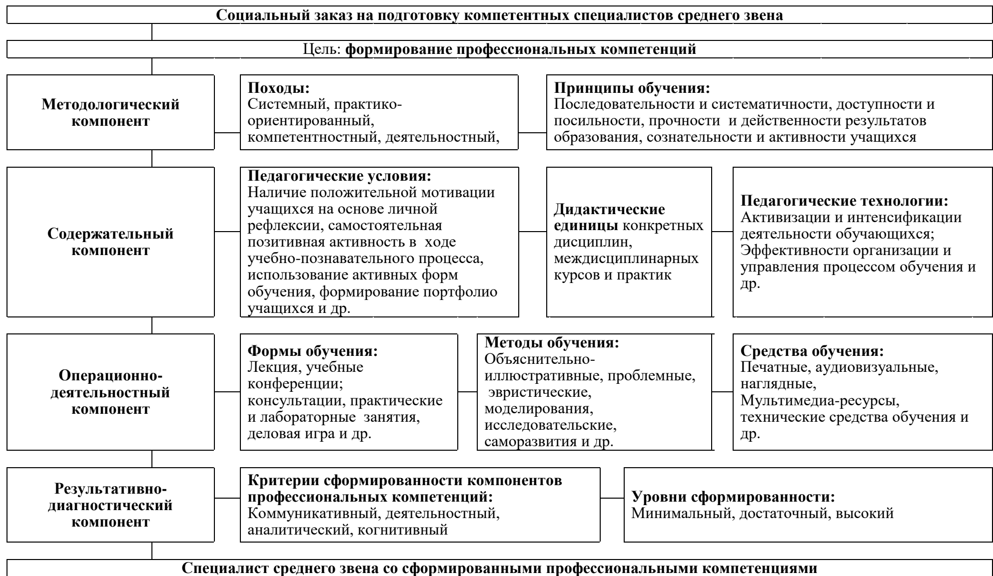
Рис. 1. Модель формирования профессиональных компонентов