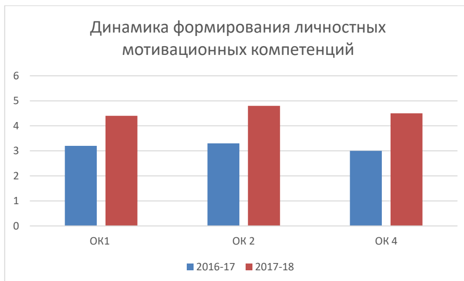
Рис. 4. Сравнения статистических данных степень влияния участия в конкурсе профессионального мастерства на уровень мотивационных компетенций

Наглядно результаты анализа представлены на рисунке 4.