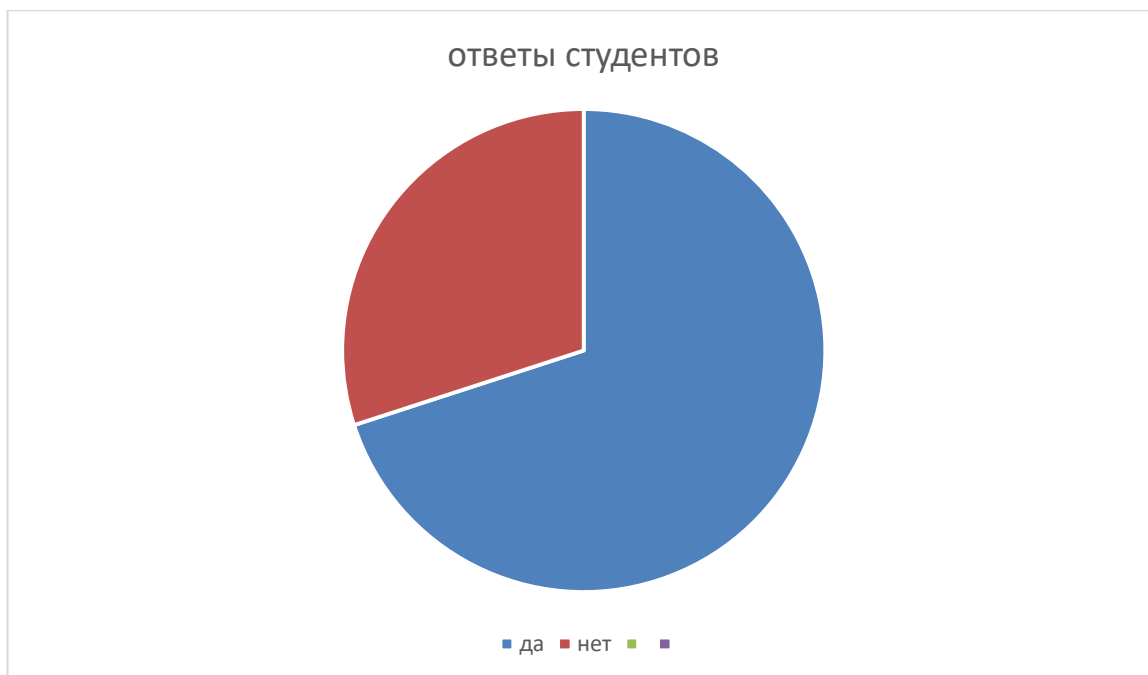
Рисунок 1 – ответы на вопрос «Применяет ли преподаватель дискуссионный метод в обучение?»

Таким образом, большинство студентов ответили, что преподаватель использует дискуссионные методы в своей работе.