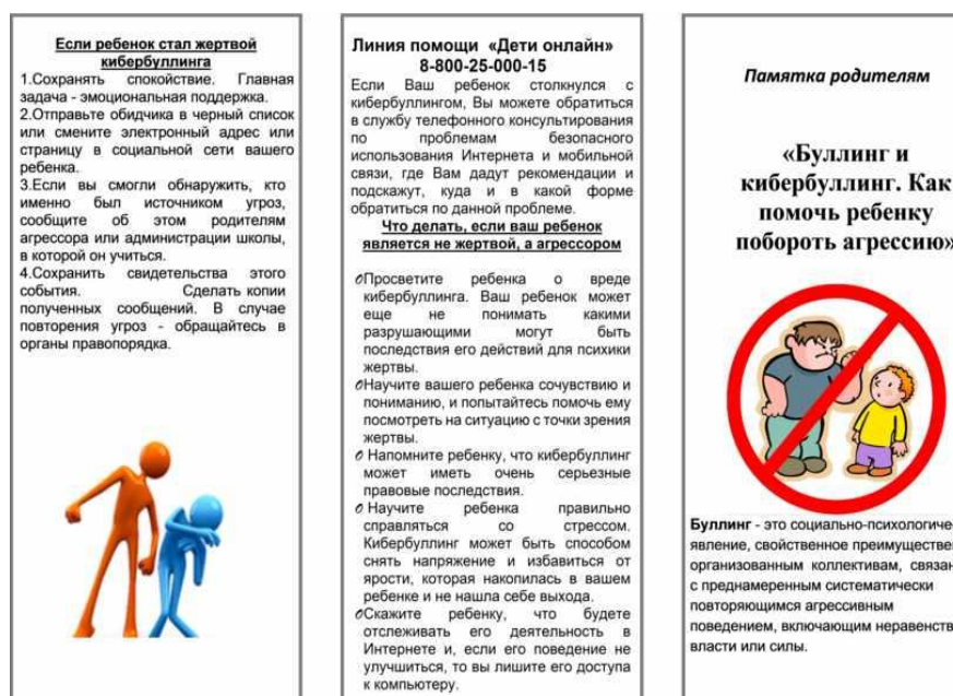
Рисунок D.1 – Буклет для родителей

А сейчас мы с вами вместе создадим буклет на тему «Кибербуллинг – что это?».