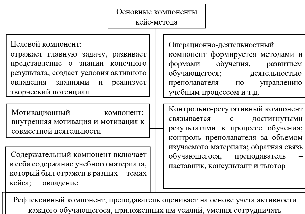
Рисунок 2 – Элементы кейс-методики

Ключевые элементы, которые рассмотрим в процессе применения кейс-методики (Рисунок 2) [14].