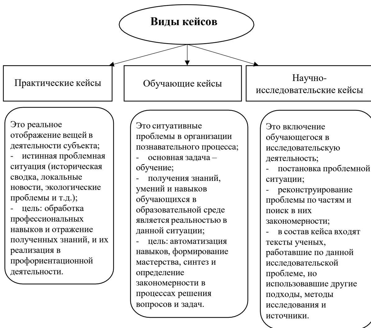
Рисунок 1 – Классификация кейсов и их описательные признаки

изучение разных проблемных сфер. Визуализировать данный принцип возможно на Рисунке 1: