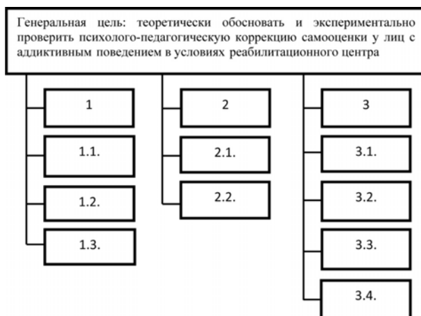
Рисунок 1 – «Дерево целей» психолого-педагогической коррекции самооценки у лиц с аддиктивным поведением в условиях реабилитационного центра

Для реализации генеральной цели предполагается проведение исследования по трем основным направлениям: