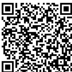
Рис. 2. Примеры дорожных карт, созданные и используемые педагогом в обучении английскому языку для достижения обучающимися образовательных результатов

Подводя итоги, замечаем, что дорожные карты, создаваемые педагогом и используемые обучающимися для самостоятельной подготовки к значимым образовательным событиям/мероприятиям (мероприятийные дорожные карты очень важны) и освоения некоторых тем в процессе изучения английского языка (учебные дорожные карты) очень важны. Использование дорожных карт в учебно-познавательном процессе, в том числе в обучении английскому языку, зарекомендовало себя как эффективный, действенный инструмент на пути к достижению важных образовательных результатов, обеспечивая мотивацию, сопровождение и ненавязчивое управление деятельностью обучающихся с эффектом присутствия педагога, его непосредственного участия. Принципы холизма и симплификации, используемые в создании дорожных карт, обеспечивают этапность осуществления деятельности, ее пошаговость.