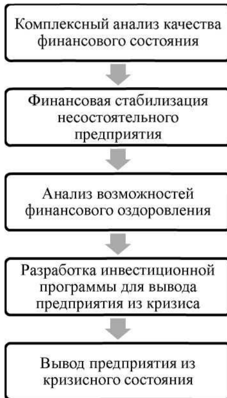
Рис. 2. Комплекс мероприятий финансового оздоровления организации

Процесс вывода организации из кризиса представляет собой набор мероприятий направленных на постепенное улучшение качества финансового состояния и перевод организации из разряда кризисных в разряд состоятельных. Это достигается в ходе реализации процесса управления несостоятельным предприятием в условиях переходной экономики, структура которого представлена на рис. 2.