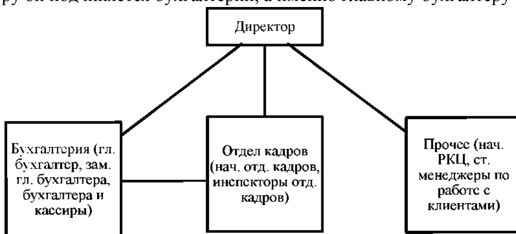
Рис. 3. Подчиненность персонала в Банке «Снежинский» ПАО.

Второй этап исследования заключается в установлении подчиненности персонала в Банке «Снежинский» ПАО. Для наглядности используем рисунок 3. Из рисунка 3 видно, что основные органы организации прямо подчинены директору, а отдел кадров имеет двойную подчиненность, помимо подчинения директору он подчиняется бухгалтерии, а именно главному бухгалтеру