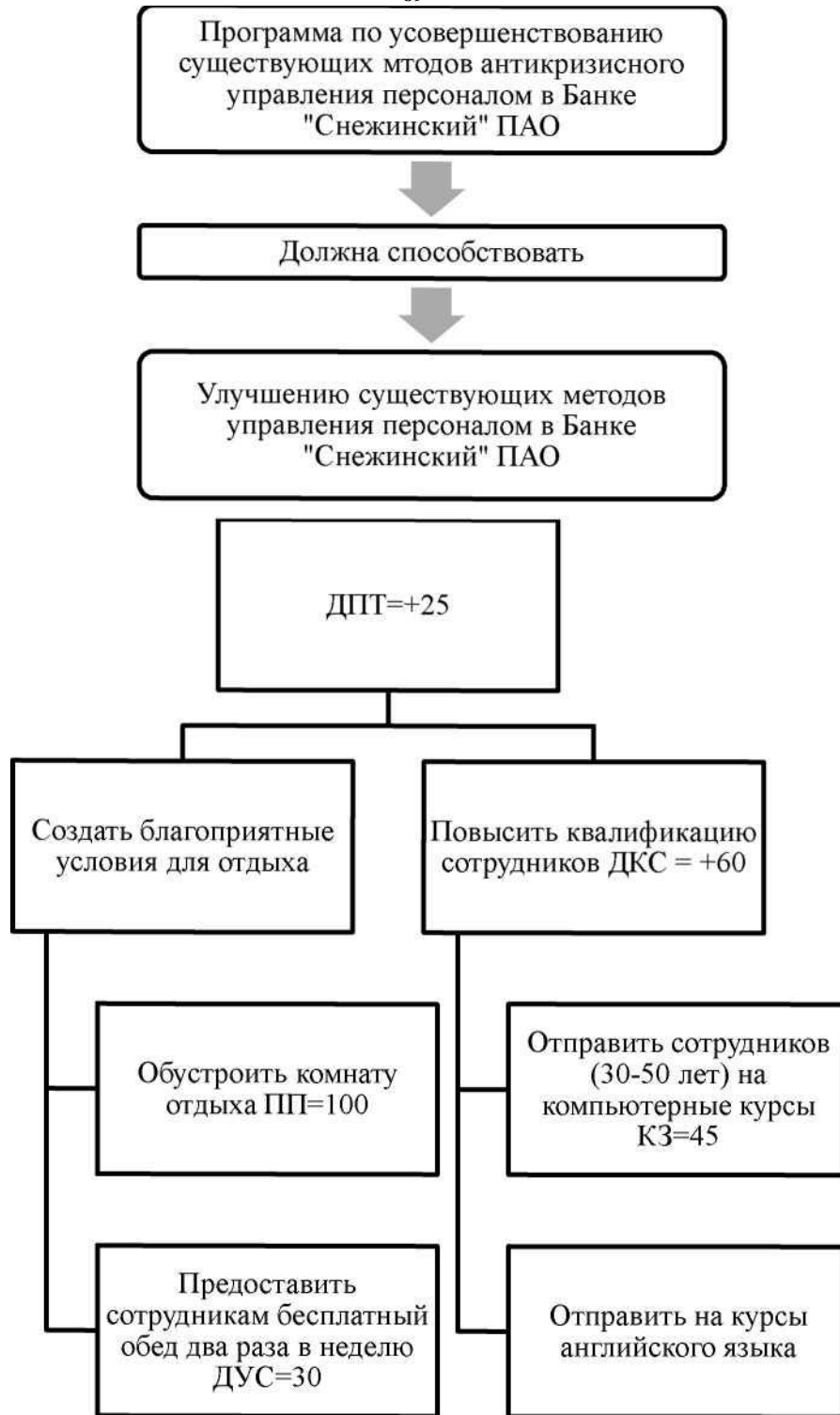
Рис. 6. Фрагмент модели целевой ориентации по усовершенствованию существующих методов управления персоналом

В таблице 7 приведено описание критериев модели целевой ориентации программы совершенствования методов эффективной системы управления персоналом.