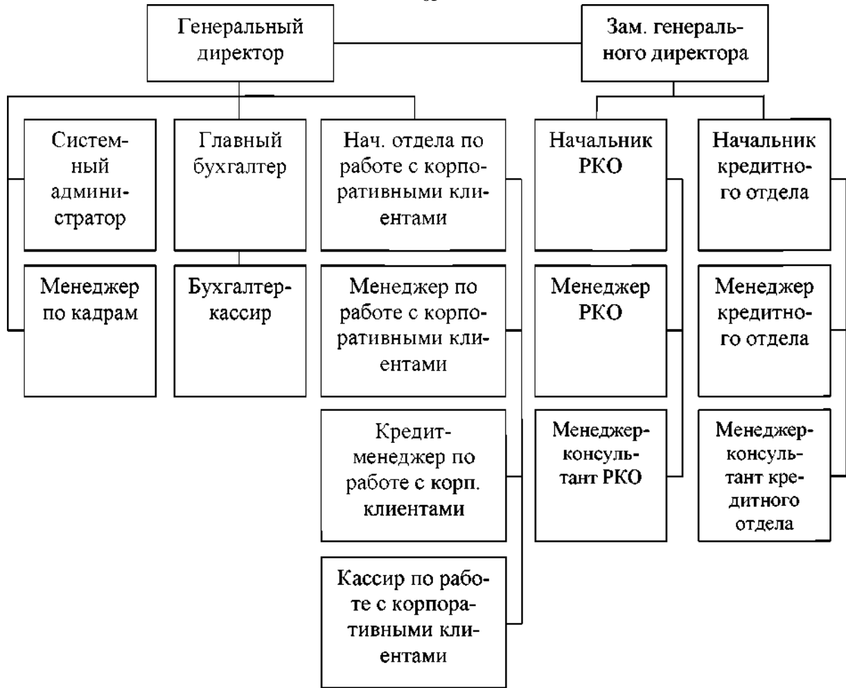
Рис. 5. Структура управления Банка «Снежинский» ПАО

Для разрешения проблем с клиентами можно создать специальное подразделение, сотрудники которого должны обладать определенными знаниями, навыками и умениями по ведению переговоров с клиентами. Прежде всего, у них должны быть хорошо развиты коммуникативные способности.