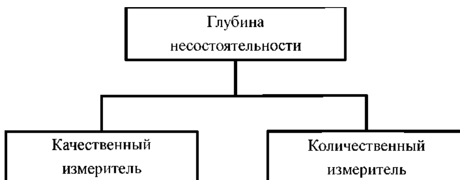
Рис.1. Предварительное измерение глубины несостоятельности

Количественный измеритель свидетельствует о том, скольким кредиторам из общего количества предприятие просрочило выплаты по долгам.