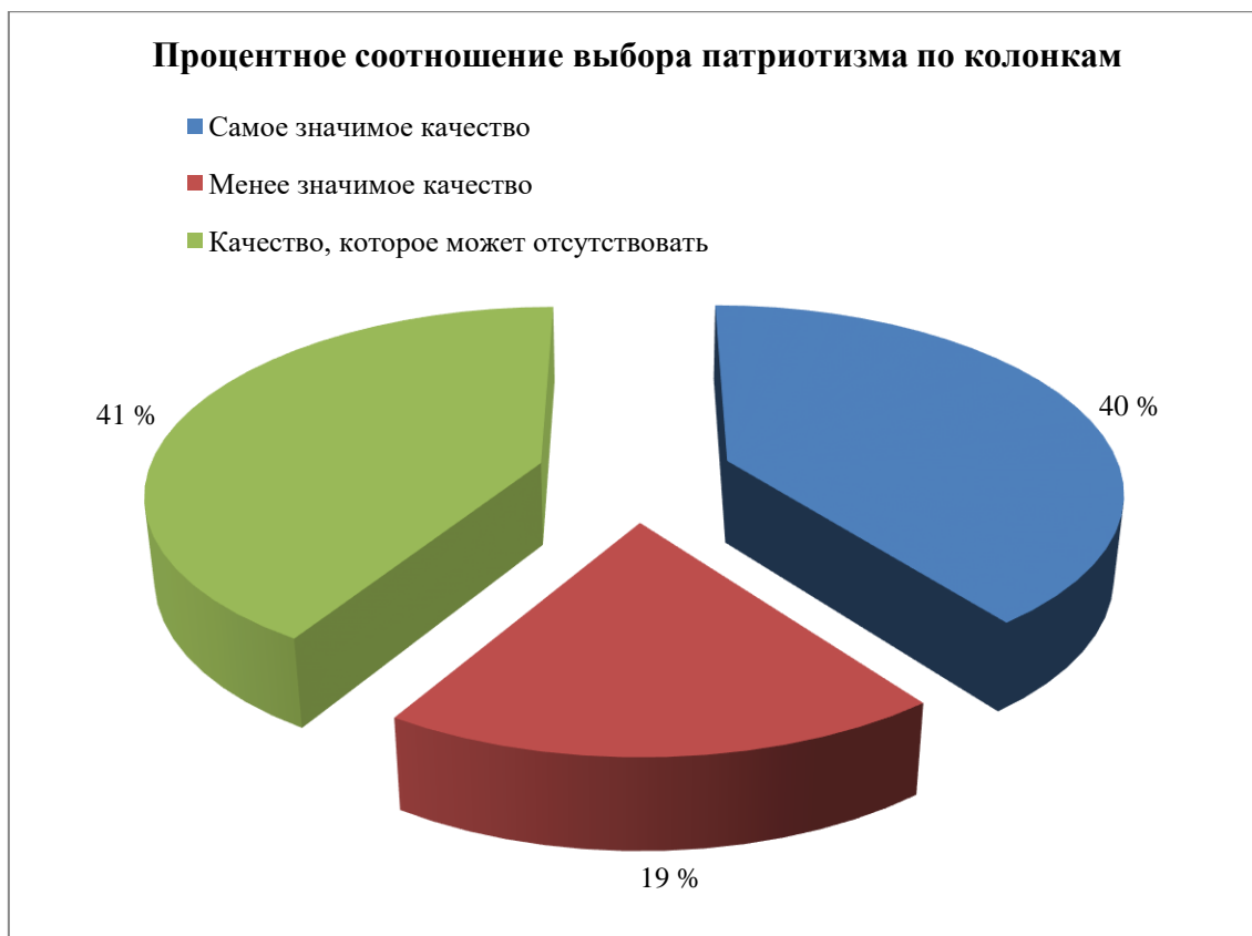
Рисунок 1 – Процентное соотношение выбора качества «патриотизм» по колонкам

Таким образом, 40 % (25 человек) записали «патриотизм» в первую колонку, то есть эти обучающиеся считают, что патриотизм самое значимое качество человека им присущее. 19 % (12 человек) отнесли патриотизм во вторую колонку, то есть к менее значимым качествам человека. И 41 % (26 человек) считают, что патриотизм – это не значимое качество, которое может отсутствовать.