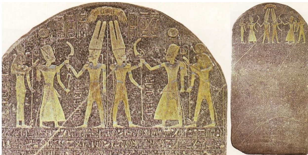
Рисунок 3 - «Стела Мернептаха» 42