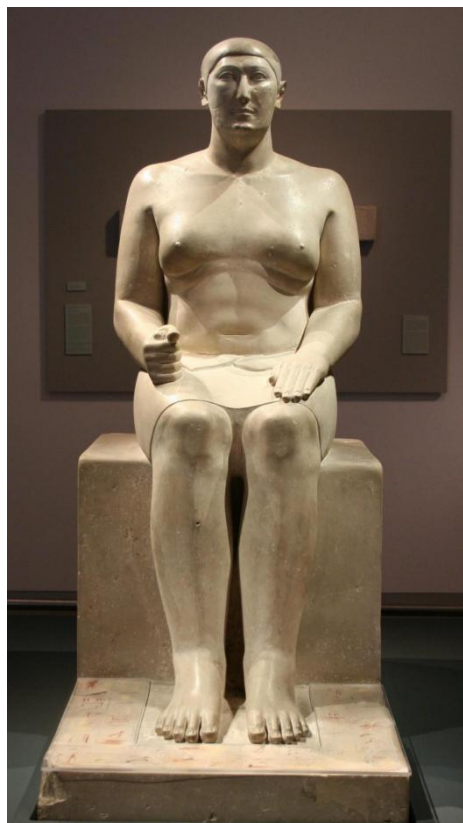
Рисунок 8 - Статуя зодчего Хемиуна 47