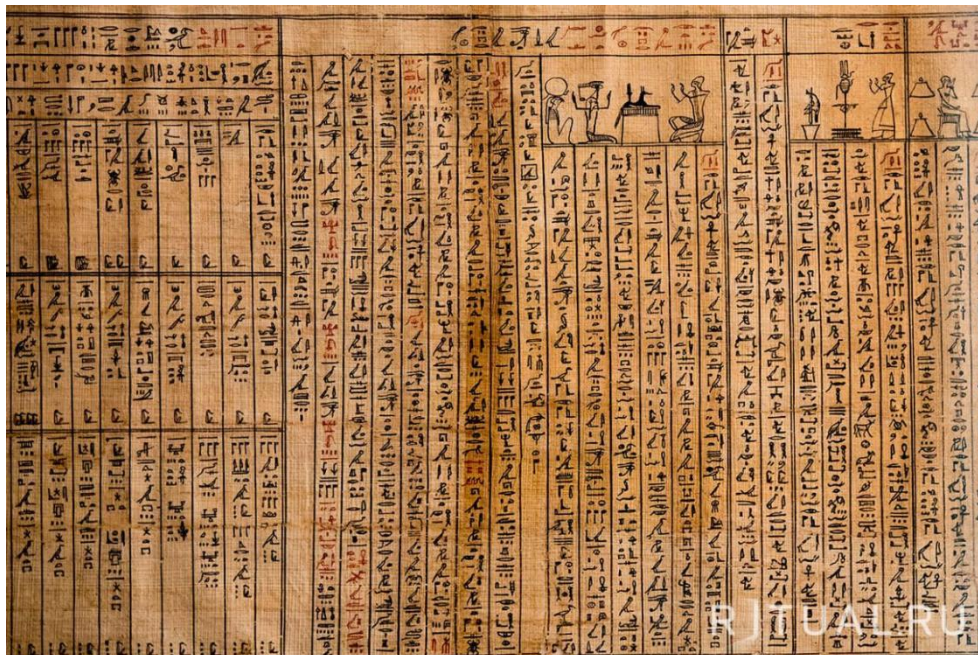
Рисунок 1 - Фрагмент древней "Книги Мертвых" (1070 г. до н.э.), Фивы – Египет 40