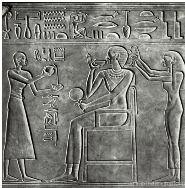
Рисунок 7 – Изображение на саркофаге Кавит 46