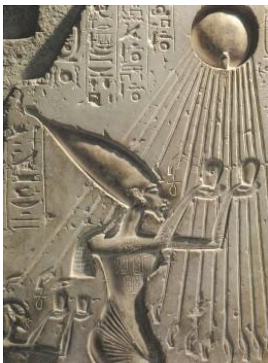
Рисунок 5 - Фрагмент стелы из дворца Эхнатона в Тель-эль-Амарне 44