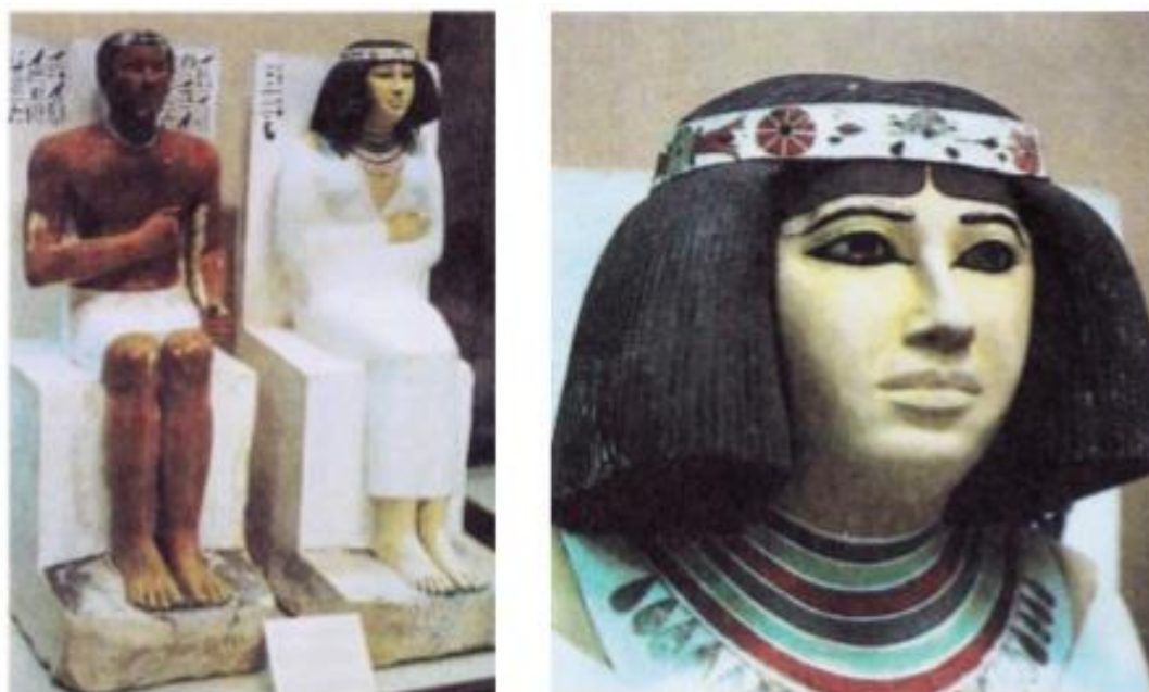
Рисунок 6 – Царевич Рахотеп и его жена Неферт 45