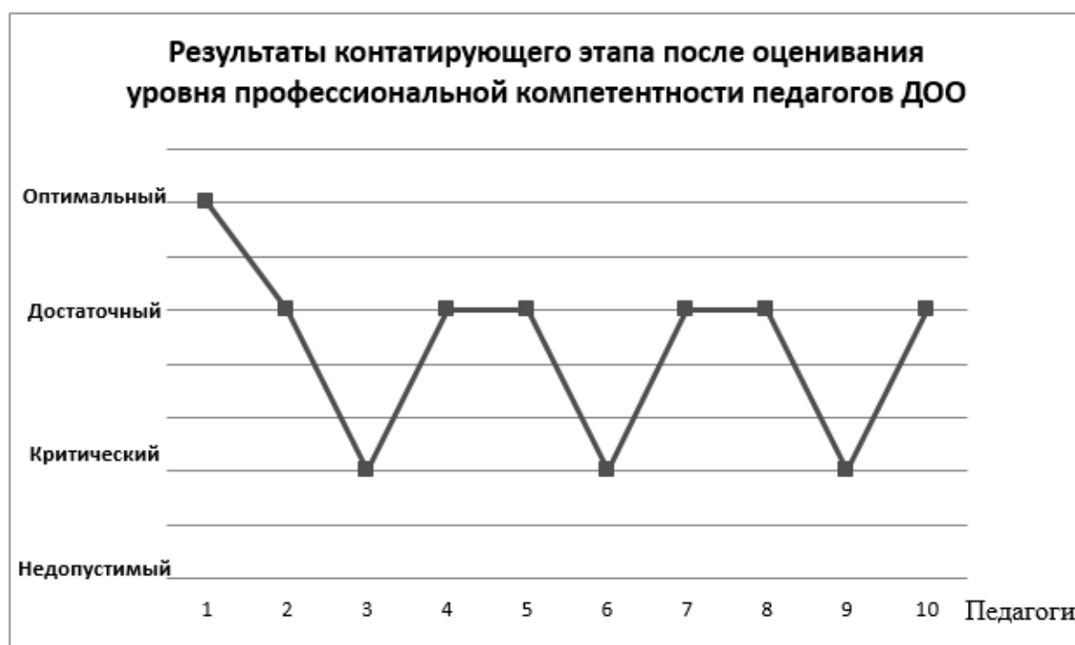
Рис. 2 Результаты оценивания уровня профессиональной компетентности педагогов ДОО (констатирующий этап)

Рассмотрим более наглядно результаты констатирующего этапа опытно-экспериментальной работы после оценивания уровня профессиональной компетентности педагога в ДОО.