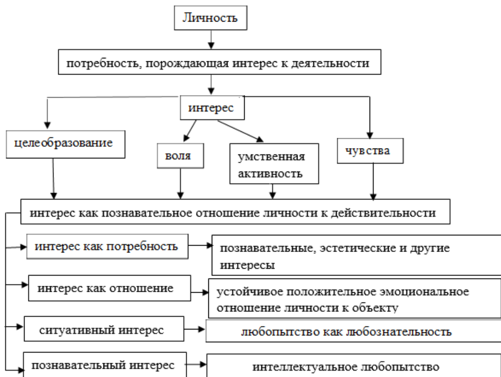
Рис.1 Структура развития познавательного интереса в старшем дошкольном возрасте

Познавательный интерес детей дошкольного возраста выражается к стремлению узнавать новые факты и явления, наличие познавательных вопросов предметного характера, интерес к познанию явных и существенных свойств предмета, увлеченная самостоятельная работа, стремление к преодолению трудностей. Мы разработали структуру познавательного интереса, которая представлена на рис.1.