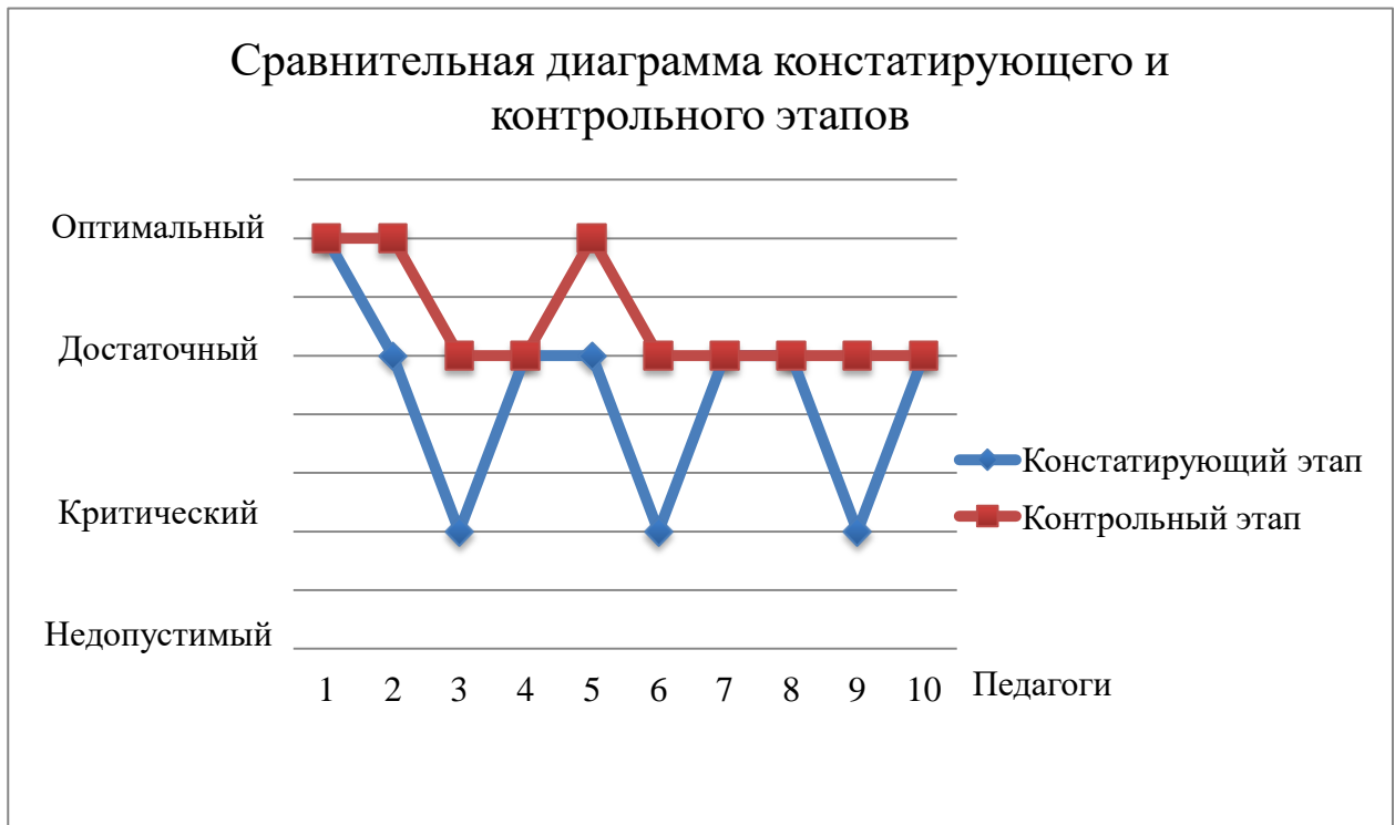
Рис 4 Результаты констатирующего и контрольного этапов после оценивания уровня профессиональной компетентности педагога в ДОО

На диаграмме видно, что на контрольном этапе отсутствует критический уровень, педагог 3, 6 и 9 поднялись на новый достаточный уровень. Педагог 2 и 5 поднялись до оптимального уровня.