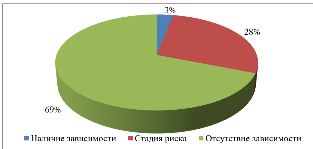
Рисунок 2 – Распределение испытуемых по уровням компьютерной зависимости по мнению их родителей

Наглядно представим результаты на рисунке рисунок 2.