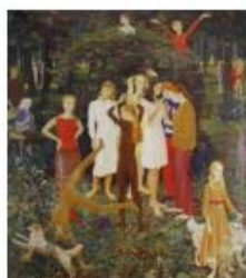
Д. Жилинский «Воскресный день»