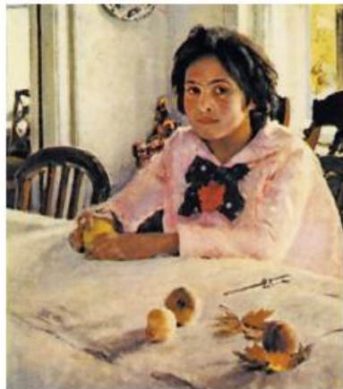
Серов В.А. «Девочка с персиками»

Проведение: испытуемым предлагается рассмотреть репродукции картин и ответить на вопросы о детях, которые изображены на картинах. Вопросы: «О чем думают эти дети»? «Какие дети по характеру»? «Какое у них сейчас настроение»?