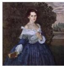
К. А. Сомов «Дама в голубом»