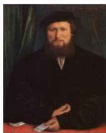
Г. Гольбейн Младший «Портрет Дирка Берка»

Инструкция: необходимо сопоставить геометрическую фигуру с репродукцией. Недопустимы наводящие вопросы экспериментатора вроде «Где ты тут видишь круг?», так как они побуждают фрагментарное видение, прямо противоположное решению задачи, предполагающей целостнообразное видение картины.