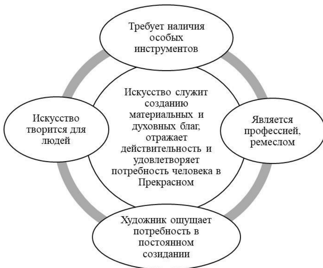
Рисунок 3. Возможное графическое описание полученных результатов Вопросы для литературоведческого анализа:

– Я шофер-дальнобойщик, – добавил он, и кружка в его рыжей волосатой лапе казалась небольшой чашкой. – Дома не бываю по пять-шесть дней. А когда возвращаюсь и вхожу к себе, особо если полдень и солнце в окна, навстречу мне – волны золотого света! »