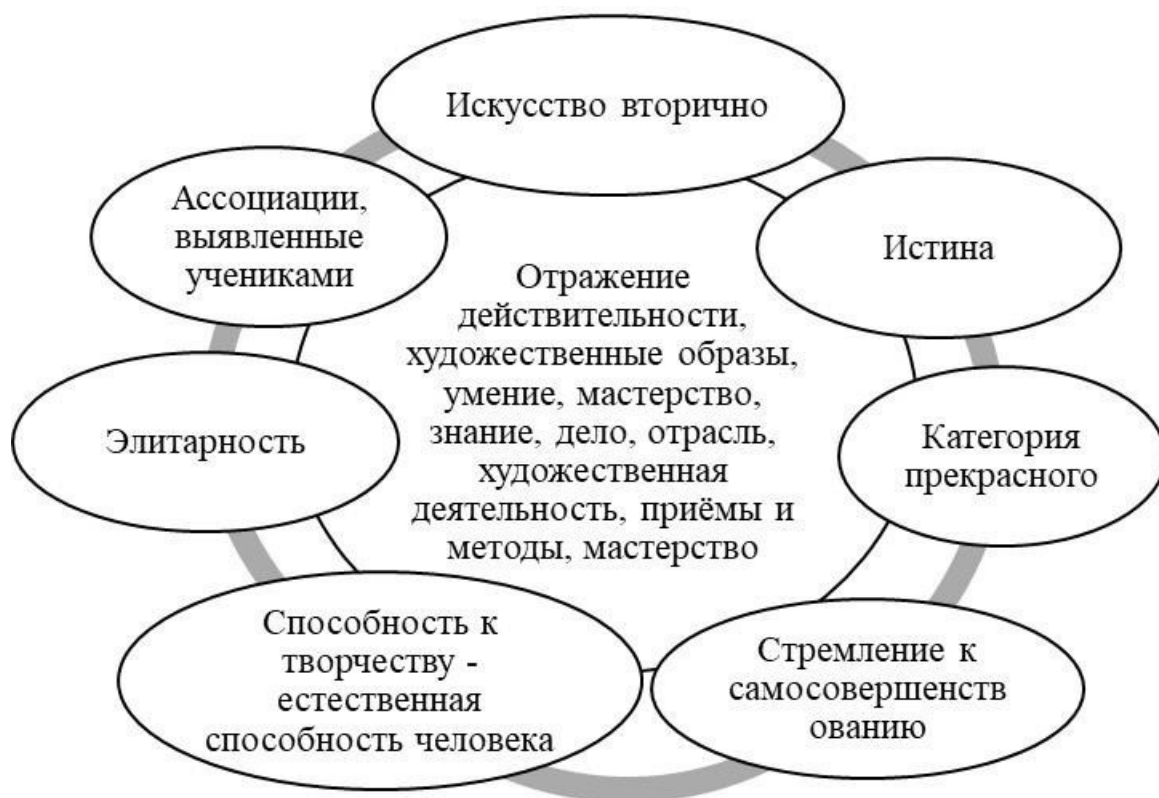
Рисунок 2. Графическое описание результатов, полученных при моделировании словарного облика концепта

V. Составление контекстуального портрета концепта «искусство» в прозаическом произведении Дины Рубиной