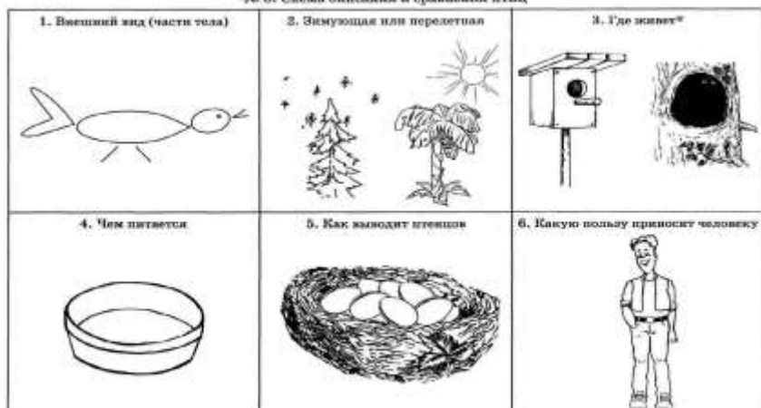
№ 8. Схема описания и сравнения птиц