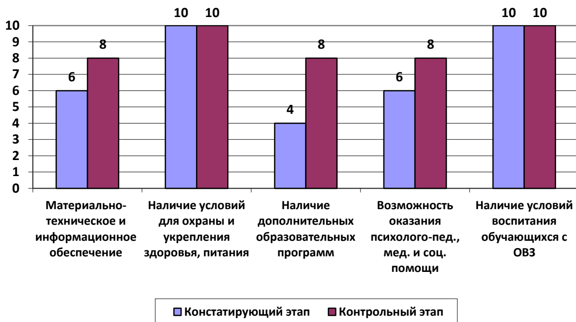
Рисунок 4. Комфортность условий образовательной деятельности, в баллах

Анализ показателей, характеризующих комфортность условий, в которых осуществляется образовательная деятельность в ДОО: