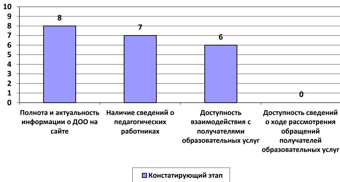
Рисунок 1. Открытость и доступность информации об образовательной организации, в баллах

Всего по итогам анализа по данному параметру набрано 21 балл из 40 возможных.