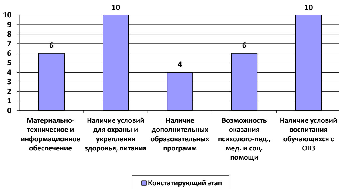
Рисунок 2. Комфортность условий образовательной деятельности, в баллах

Всего по итогам анализа по данному параметру набрано 31 балл из 50 возможных.