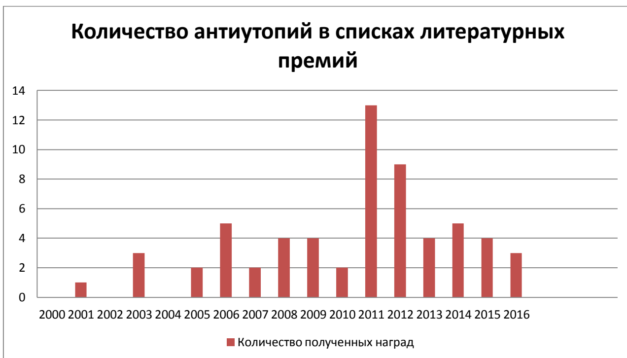
Рис.1 Количество антиутопий в списках литературных премий по версии YALSA 2000-2016 гг. [2]

Активное развитие этого жанра началось несколько позже — некоторые исследователи связывают его возросшую популярность с последствиями теракта 11 сентября 2001 г., повлиявшего на такие произведения как роман «Feed» американского автора Мэтью Т. Андерсона (2002, не переведен), роман «Уродина» англо-австралийского фантаста Скотта Вестерфельда (оригинал — 2005, перевод — 2008); роман «Младший брат» канадца Кори Доктороу (оригинал — 2008, перевод — 2010) и на литературную тенденцию в целом. Так или иначе, в двухтысячных годах произведения, написанные в жанре антиутопии и адресованные подросткам, приобрели статус одного из ведущих направлений в литературе для аудитории «young adult» [6].