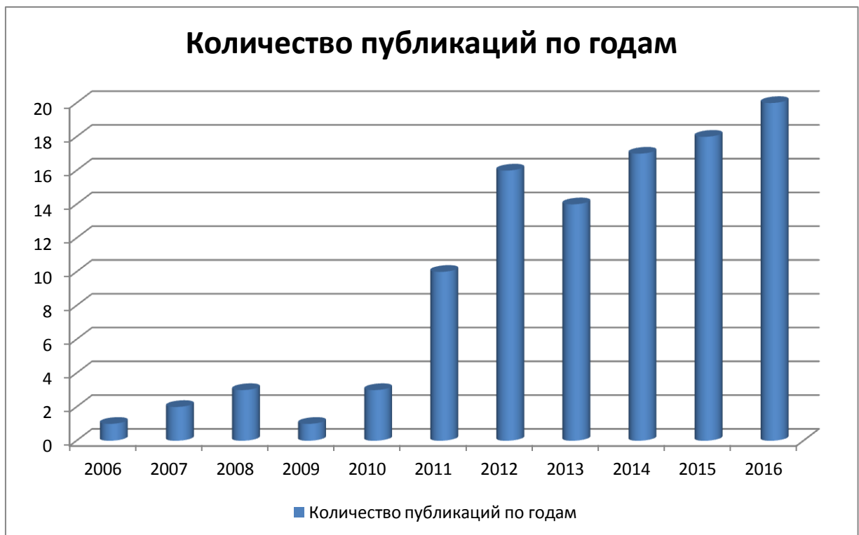
Рис. 2 Количество подростковых антиутопий, изданных на русском языке в 2006-2016 гг. [2]