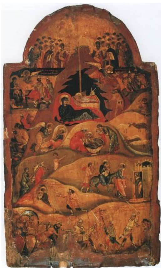
Рождество Христово, Андрей Рублев

Икона. Конец XI – нач. XII в. Константинополь. Монастырь св.Екатерины, Синай