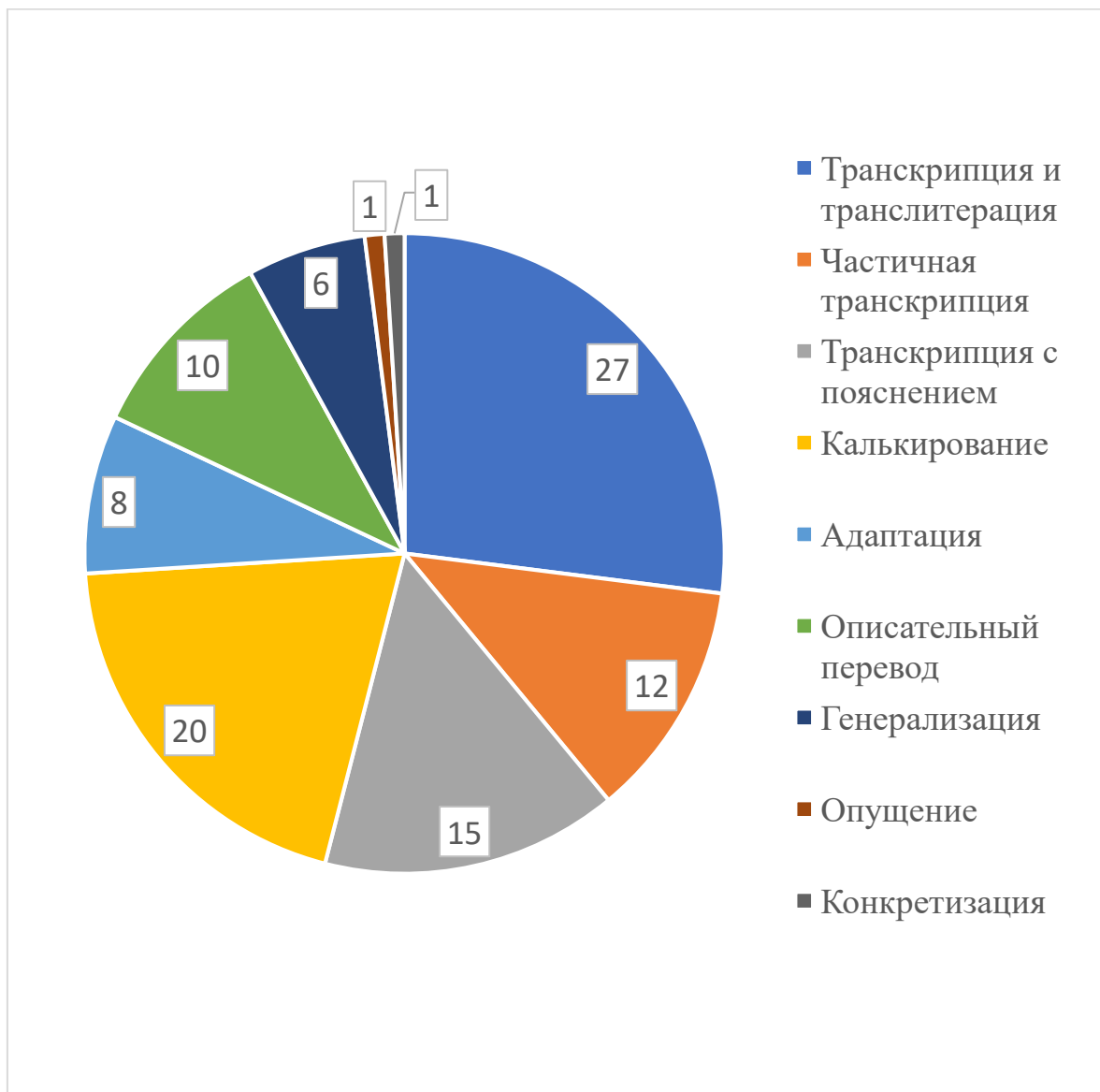
Рис 1. Способы перевода французских гастрономических реалий