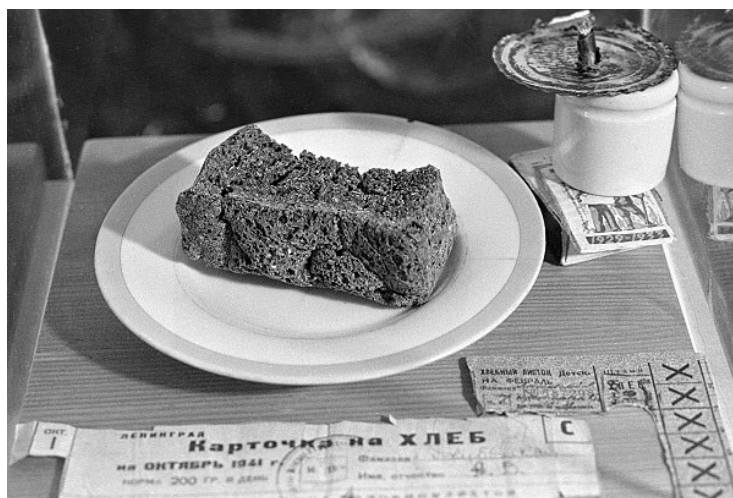
Рисунок 4 — Блокада Ленинграда