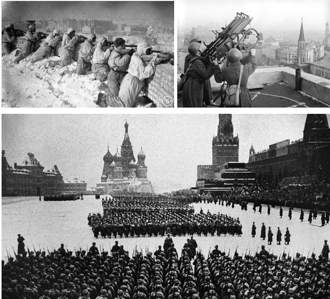
Рисунок 2 — Оборона Москвы в годы Великой отечественной войны

Гитлеровское командование поставило задачу овладеть Москвой — политическим и военно-стратегическим центром Советского Союза. Оно разработало крупную стратегическую наступательную операцию под кодовым названием «Тайфун». План наступления немецкой группы армий «Центр» был следующим: с трёх направлений мощными ударами танковых группировок окружить в районе Брянска и Вязьмы основные силы Красной Армии, обойти Москву с севера и юга и захватить её в клешни. Командующим группой армий «Центр» был назначен Федор фон Бок. Немцы бросили в бой 1800000 сол-