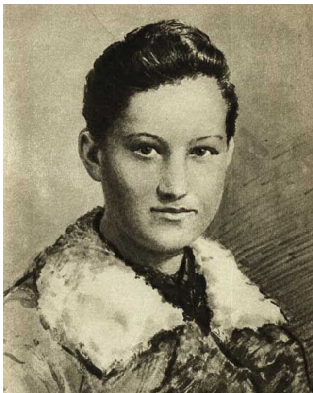
Рисунок 3 — Зоя Космодемьянская

Это памятник Зое Космодемьянской (рисунок 3).