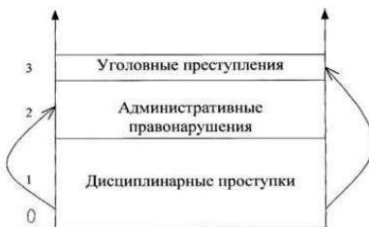
Рисунок 1 – Уровни противоправного деяния

На рисунке 1 приведены три уровня, на которые можно разделить противоправные деяния, совершаемые студентами профессиональных организаций.