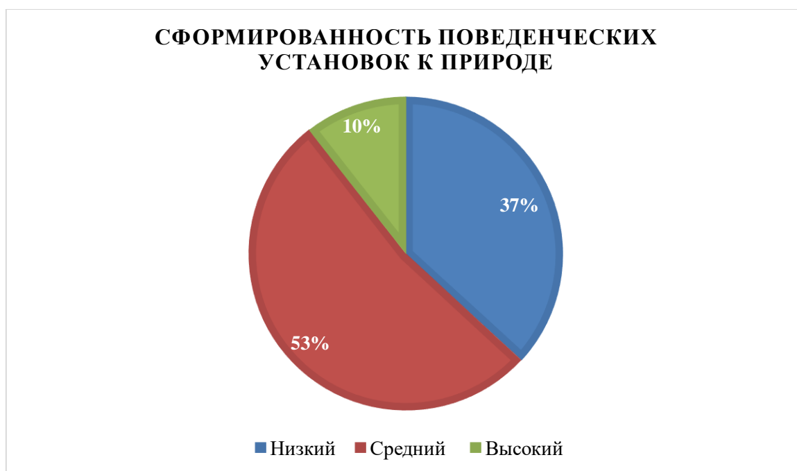
Рисунок 4 – Результаты диагностики поведенческих установок к миру природы по методике «Отношение к природе» (Т.А. Серебряковой)