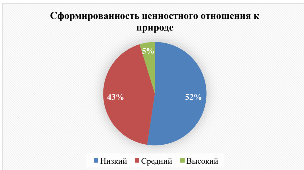
Рисунок 1. Сформированность ценностного отношения к природе у дошкольников в экспериментальной группе

Результаты, приведенные в Табл. 1 и на Рис.1, свидетельствуют о том, что в обеих группах обследуемых дошкольников преобладающим уровнем ценностного отношения к природе является низкий – 57,1% и 52,3% соответственно. В ходе обследования выяснилось, что многие дети обладают лишь начальным уровнем понимания ценности природных объектов; затрудняются ответить, в частности, на вопросы о том, зачем нужны животные и растения и что нужно растениям и животным, чтобы хорошо себя чувствовать. Не более 4,8% в обеих обследованных группах дошкольников обнаружили высокий уровень понимания ценности природных объектов (ответили на все вопросы правильно лишь по 1 ребенку в той и другой группе).