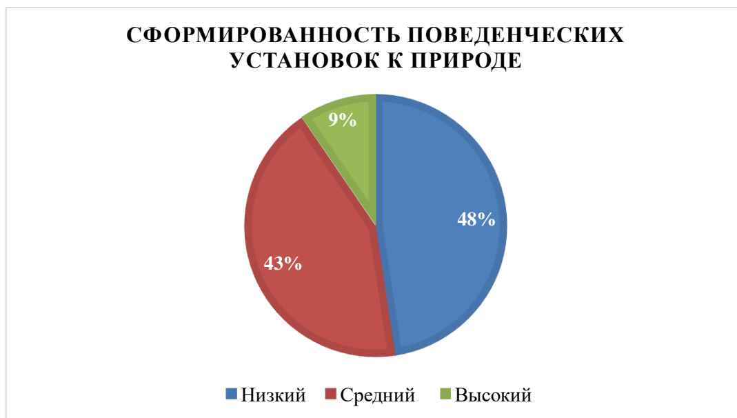
Рисунок 2 – Результаты диагностики поведенческих установок к миру природы по методике «Отношение к природе» (Т.А. Серебряковой)

В результате реализации диагностики 2 был выявлен уровень поведенческих установок к природе как ценности – между средним и низким. Что дало основание для формирующего этапа эксперимента.