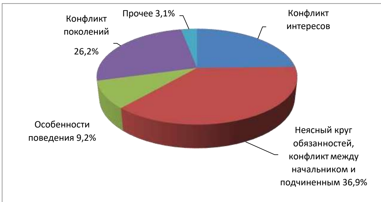
Рис. 3. Причины конфликтов на предприятии

Таким образом, по данным опроса 36,9% конфликтов возникают по причине неясного круга обязанностей или конфликта между начальником и подчиненным. Каждый работник должен понимать, за решение каких задач он отвечает, а что находится вне его компетенции. Если руководитель не может распределить обязанности между сотрудниками, определить зону ответственности, формулирует задачу расплывчато – это дает повод для конфликтов. Кроме того, скрывая важную информацию от сотрудников, руководство может спровоцировать возникновение слухов. В кризисных условиях, когда обстановка в коллективе напряжена, неосторожное слово может повлечь за собой череду сплетен и домыслов, провоцируя конфликты.