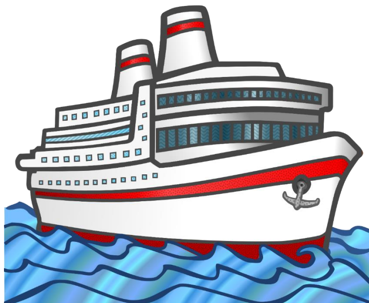
Рисунок 2 – Изображение корабля для беседы с детьми социометрический метод