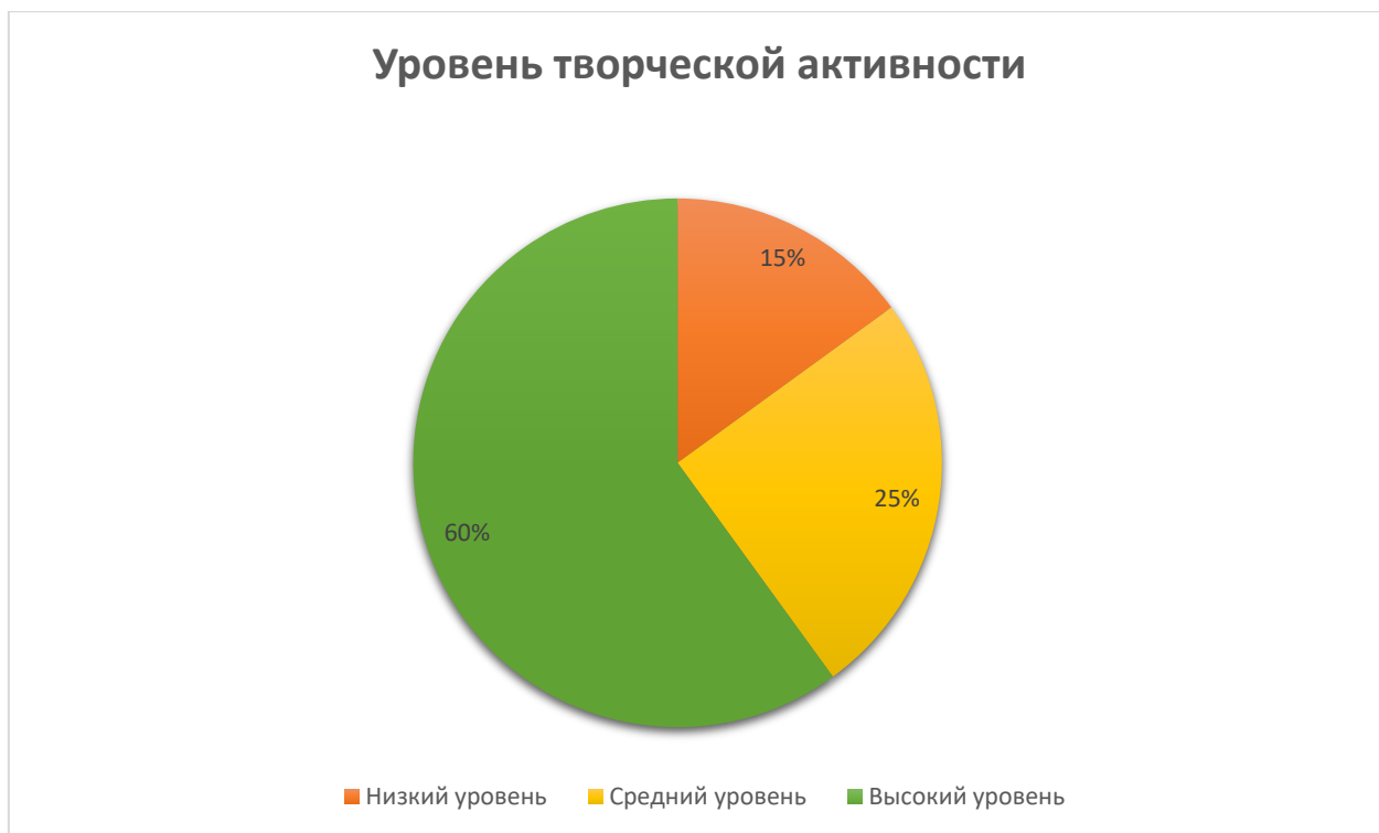
Рис. 2. Результат вторичной диагностики уровня творческой активности обучающихся

После реализации комплекса мероприятий по развитию творческой активности обучающихся была проведена повторная диагностика по методике М.И. Рожкова, Ю.С. Тюнникова, Б.С. Алишева, Л.А. Воловича. По результатам вторичной диагностики выяснилось, что низкий уровень творческой активности обучающихся снизился до 15% (3 человек), средний уровень – 25% (5 человек), высокого уровня творческой активности достигли 12 человек, что составляет 60% от общего числа группы (рисунок 2).