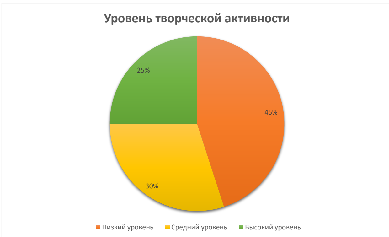
Рис. 1. Результаты первичной диагностики уровня творческой активности обучающихся 8 класса ДХШ №1

По результатам диагностики было выявлено, что низкий уровень развития творческой активности выявлен у 9 человек, что составляет 45% от общего числа группы, средний уровень - 6 человек - 30% обучающихся, а высокий уровень зафиксирован у 5 человек, что составляет лишь 25% от общего числа группы. Низкий и средний уровень творческой активности преобладают в данной группе. Полученные результаты обуславливают необходимость проведения ряда мер по развитию творческой активности обучающихся. Ведь деятельность обучающихся на прямую зависит от их активности. Результаты первичной диагностики представлены в виде диаграммы на рисунке 1.