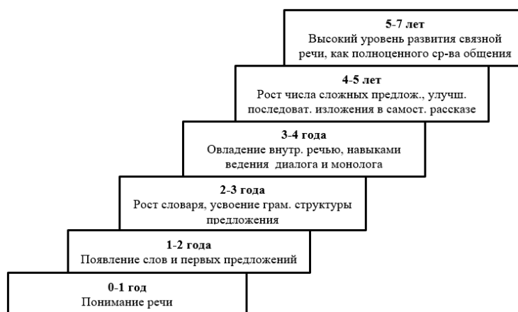
Рисунок 1 – Схема развития связной речи у детей дошкольного возраста в онтогенезе (по М.М. Алексеевой, В.И. Яшиной)

Далее рассмотрим становление связной речи у детей дошкольного возраста в онтогенезе (рисунок 1).