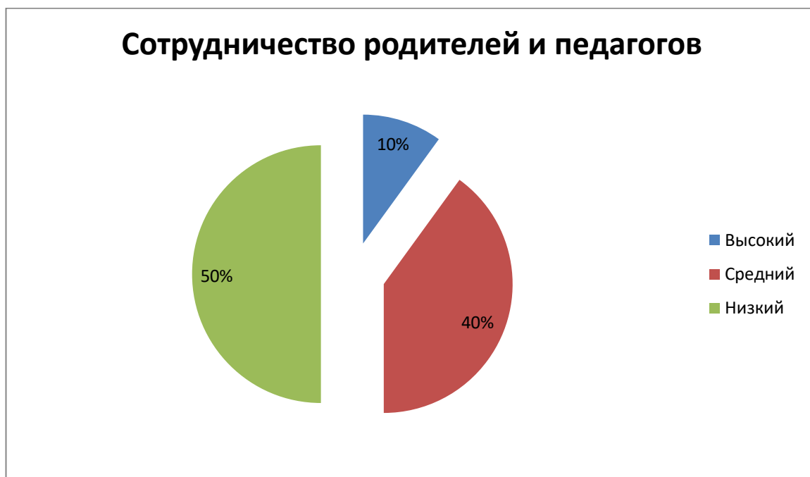
Рисунок 5 – Сотрудничество родителей и педагогов

В нашем опросе участвовали 10 родителей воспитанников экспериментальной группы. Предоставим результаты на рисунке 5.