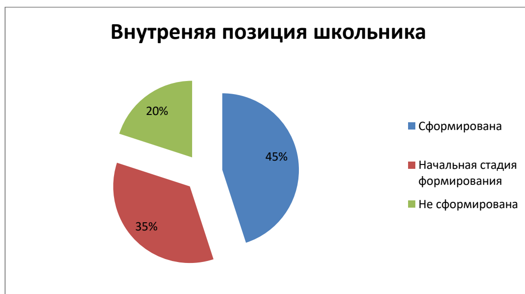
Рисунок 6 – Результаты итогового этапа исследования по стандартной беседе в ЭГ

Для наглядности результатов обратимся к рисунку 6.