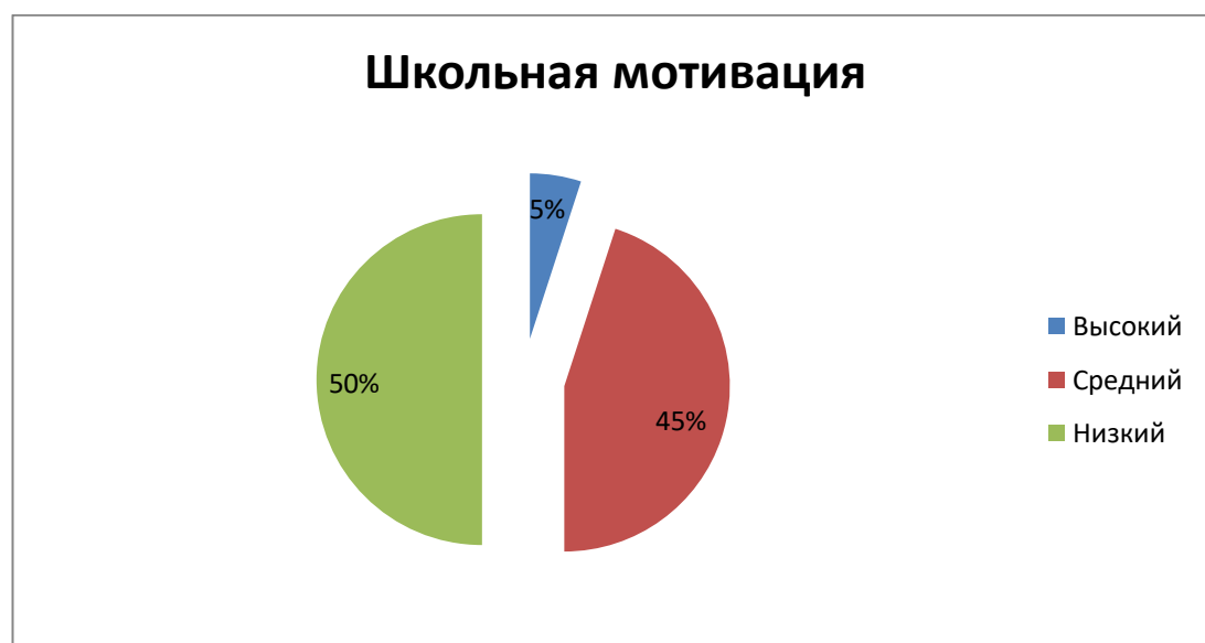
Рисунок 9 – Результаты итогового этапа исследования по школьной мотивации в КГ

Для наглядности результатов обратимся к рисунку 9.