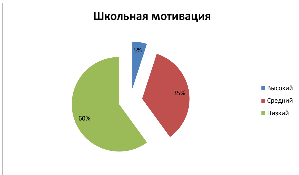
Рисунок 2 – Результаты констатирующего этапа исследования по школьной мотивации в ЭГ

Для наглядности результатов обратимся к рисунку 2.