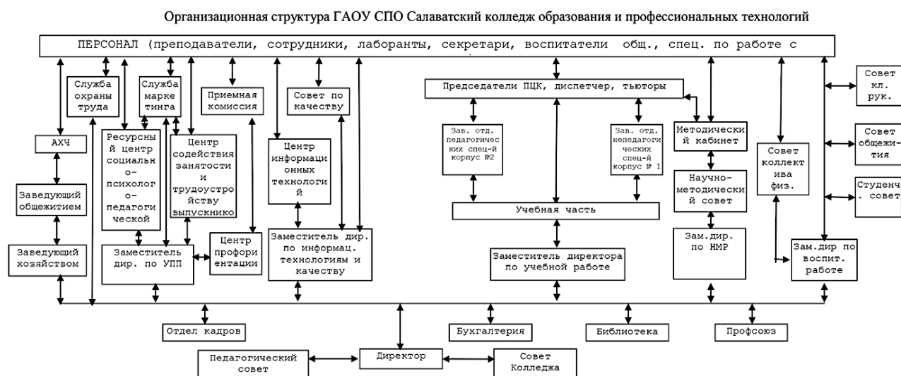
Рисунок 1 – Организационная структура ГАПОУ «Салаватский колледж образования и профессиональных технологий»

На рисунке 1 представлена организационная структура ГАПОУ «Салаватский колледж образования и профессиональных технологий».