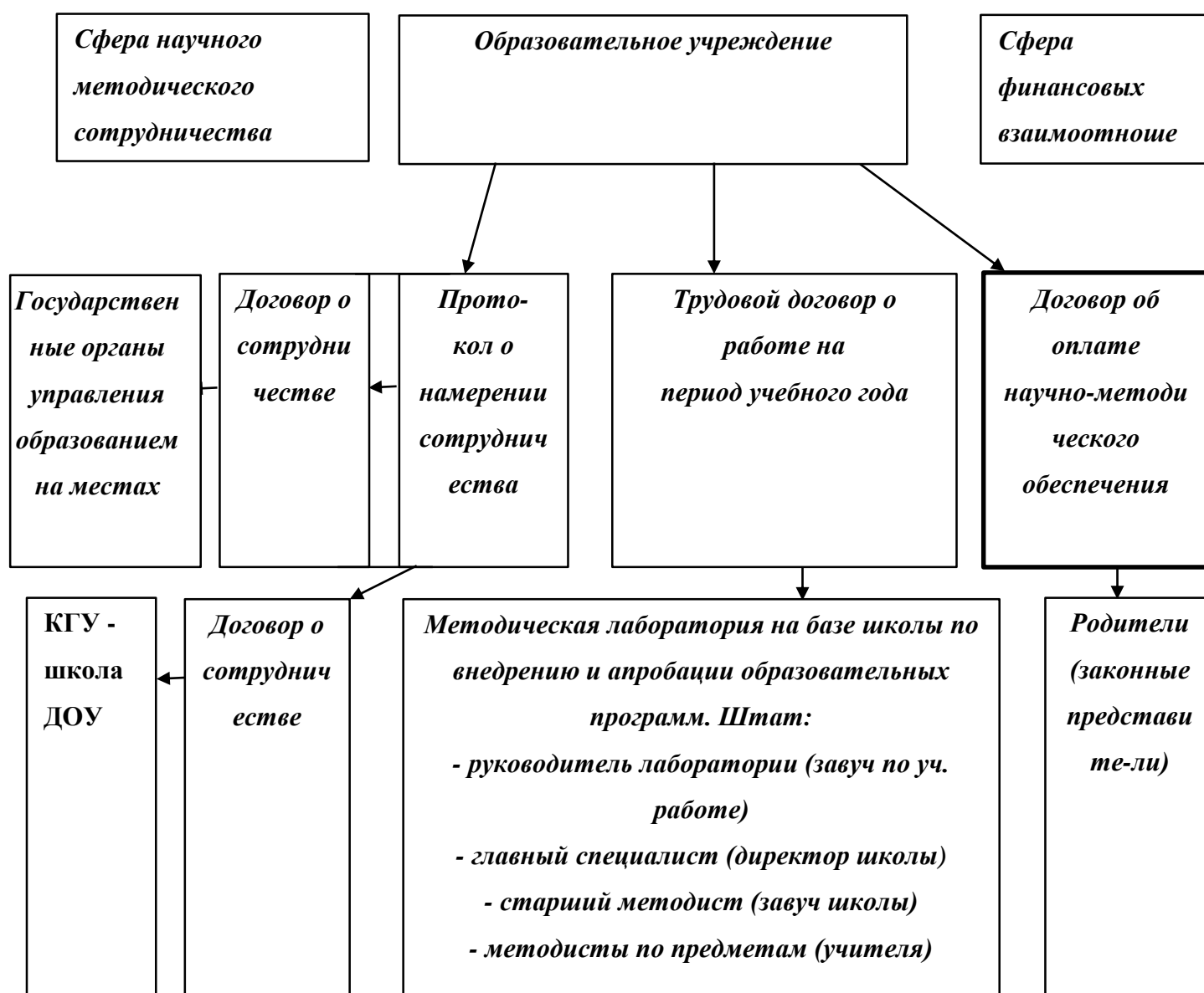
Схема организации работы по формированию кадрового потенциала в государственных образовательных учреждениях

Вопросы нормативно-правовой базы формирования кадрового педагогического потенциала остаются на сегодня важными, потому что это один из способов повышения качества образовательного процесса, так как цель - стимулирование роста профессиональных и творческих позиций конкретного учителя - воспитателя.