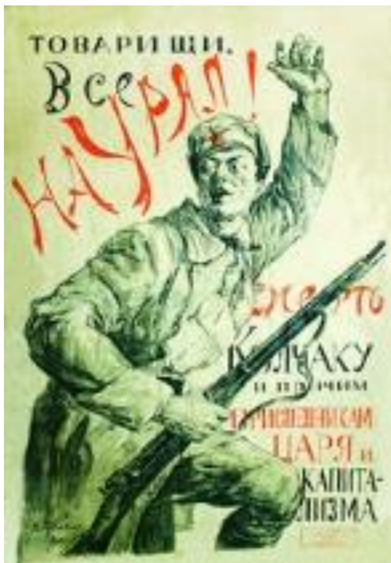
Фотография 3. Плакат «Товарищи, все на Урал!» 89