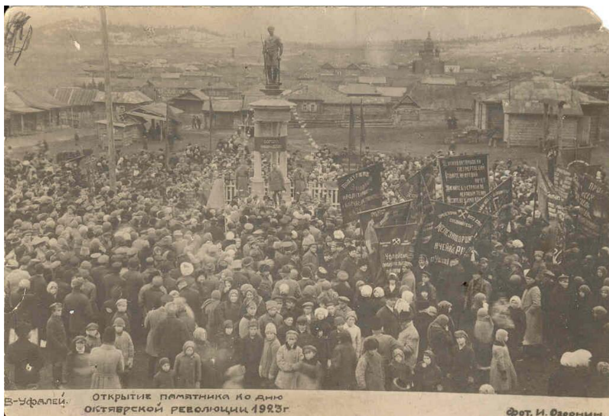
Фотография 6. Открытие памятника ко дню Октябрьской революции, 1923 г. 92