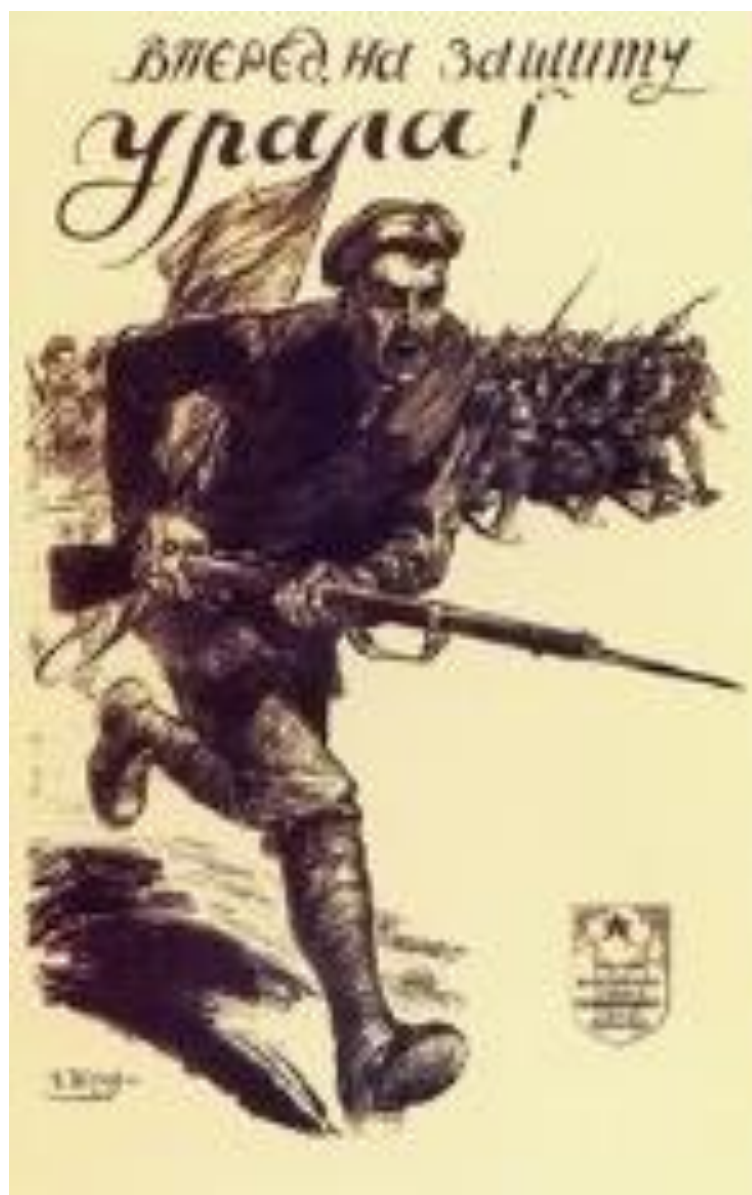
Фотография 4. Плакат «Вперед, на защиту Урала!» 90