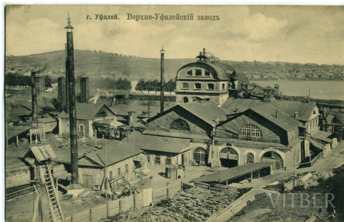
Фотография 5. Открытка «Верхний Уфалей, город в Челябинской области. Верхне-Уфалейский завод, Российская империя, нач. XX в.» 91