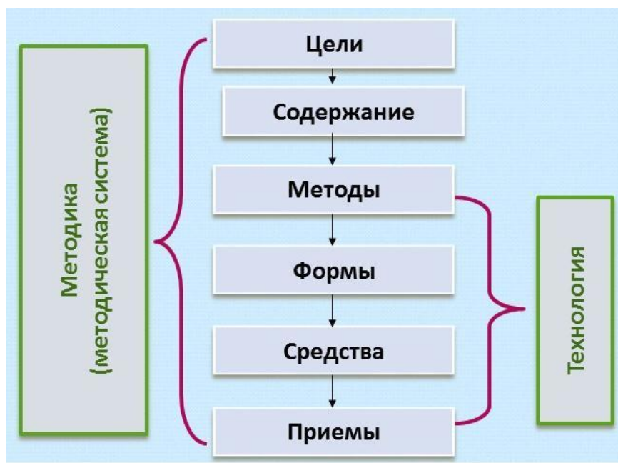
Рис. 1 Технология и методика (взаимосвязь)

Методы учения – это разработанная с учетом дидактических принципов и закономерностей система приемов и соответствующих им правил учения, целенаправленное применение которых существенно повышает эффективность самоуправления личности ученика в различных видах деятельности и общения в процессе решения определённого типа учебных задач.