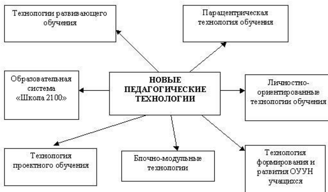
Рис. 2. Новые педагогические технологии

Проблемное обучение - это система развития учащихся в процессе обучения, в основу которой положено использование учебных проблем в преподавании и привлечение школьников к активному участию в разрешении этих проблем.