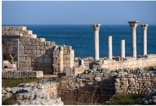
Рисунок 2. Херсонес Таврический

Учитель. Здесь, в Херсонесе Таврическом, князь Владимир принял крещение в 988 году. Формирование Древнерусского государства в IX–X веках было сложным процессом, и принятие здесь, на Крымском полуострове, христианства было важной частью его становления.