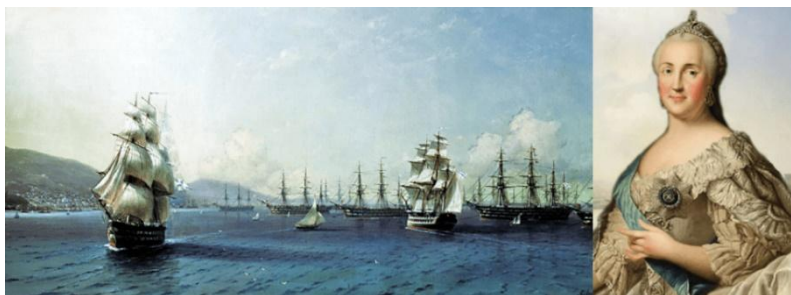
Рисунок 3. Флот Екатерины Великой

Учитель. Верно, это город Севастополь, ставший главной базой русского Черноморского флота.