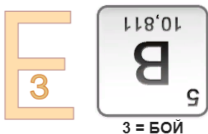
Рисунок 6. Ребусы

КОНКУРС 4. Тоннель с обручем. Эстафета с прохождением через спортивный мешок-тоннель, за победу +1 очко к здоровью.