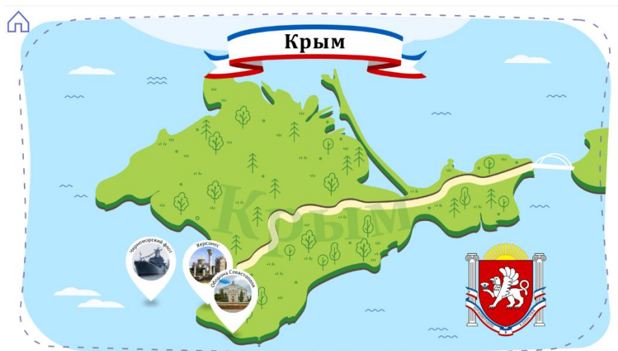
Рисунок 1. Карта полуострова Крым

Учитель запускает интерактивную карту полуострова Крым.