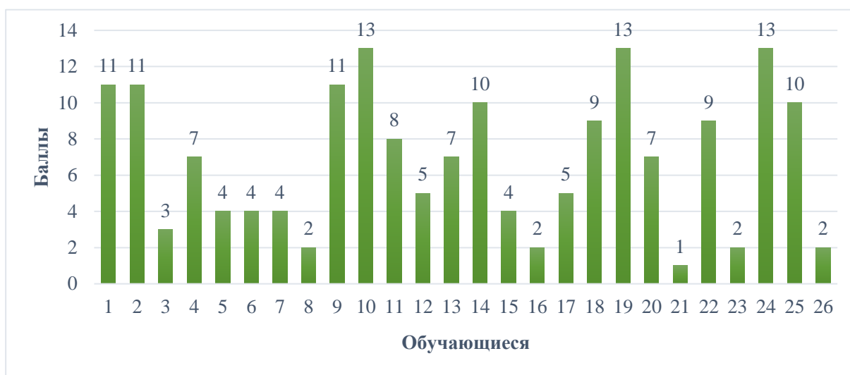
Рисунок 2 – Результаты исследования умения детей анализировать информационный текст

Второе диагностическое задание работы были предложены заданий к информационному тексту. Результаты представлены на рисунке 2.