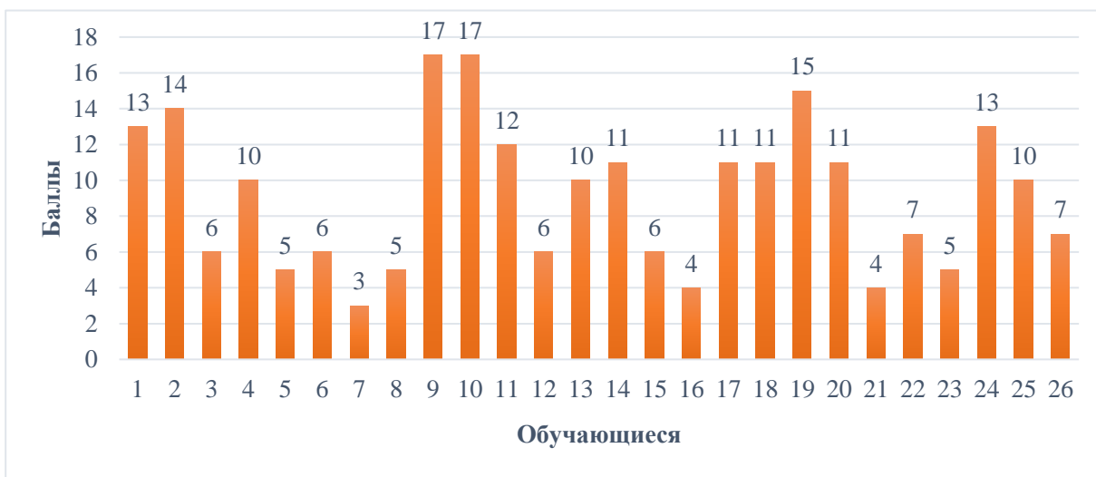
Рисунок 1 – Результаты исследования умения детей анализировать художественный текст

На первом этапе для обучающихся были предложены задания для художественного текста. Результаты представлены на рисунке 1.