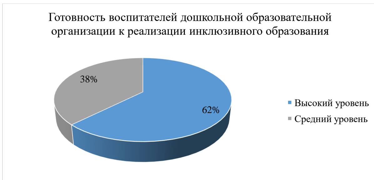
Рисунок 2 – Готовность воспитателей дошкольной образовательной организации к реализации инклюзивного образования на контрольном этапе эксперимента

38% педагогов демонстрируют средний уровень готовности к реализации инклюзивного образования: у педагога имеются ограниченные знания в области инклюзивного образования, недостаточно знаний о формах и методах работы с детьми с нарушениями в развитии. Педагог психологически может быть не готов к работе с детьми с ОВЗ. Недостаточно уверен в своих умениях и навыках по организации совместного образования детей возрастной нормы и детей с ОВЗ, хотя готов к освоению новых педагогических технологий для обеспечения условий организации инклюзивного образования.