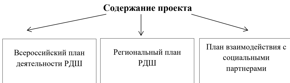
Рисунок 2 – Содержание проекта

Рассмотрим по порядку все направления деятельности проекта более подробно.